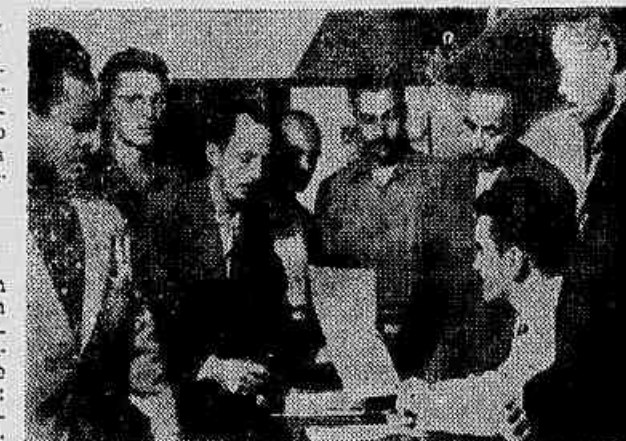
A comissão de trabalhadores da construção civil ontem, na redação

«TRABALHADORES DA CONSTRUÇÃO CIVIL: A luta que se desenvolve em todo o território nacional com a participação de personalidades e organizações representativas de todas as classes e camadas sociais como sejam: Clube de Engenharia, Sindicato da Construção Civil, Sindicato dos Engenheiros do Rio