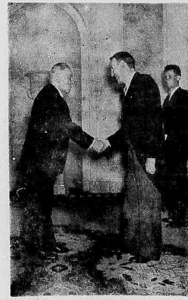
APRESENTAÇÃO DE CREDENCIAIS — Vem na capital o embaixador extraordinário e plenipotenciário dos Estados Unidos na União Soviética, sr. Thompson, ao apresentar credenciais ao presidente do Presidium do Soviet Supremo da URSS, marechal Klement Voroshilov.

A entrada nos campos de experiência rigorosamente proibida ao público e, por isso, em seu manifesto, os «quakers» observam que «vão desobedecer a lei» mas que «não têm os recursos necessários para se fazerem ouvir pelo povo norte-americano e que esperam, assim, atingir a opinião pública através da imprensa e das suas responsabilidades».