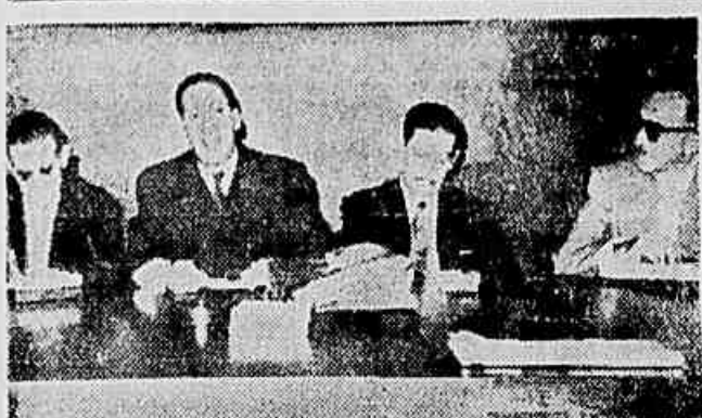
O delegado argelino Ferah Abbas, ao centro, durante a entrevista coletiva de ontem

Desfecho da crise provocada por indisciplina de oficiais — A medida favoreceria o restabelecimento de um clima de disciplina na Aeronáutica