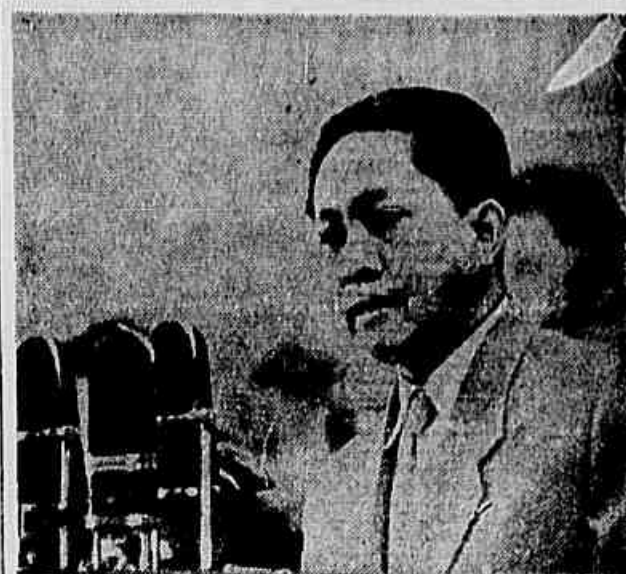
Adil, secretário geral do P.C. de Indonésia