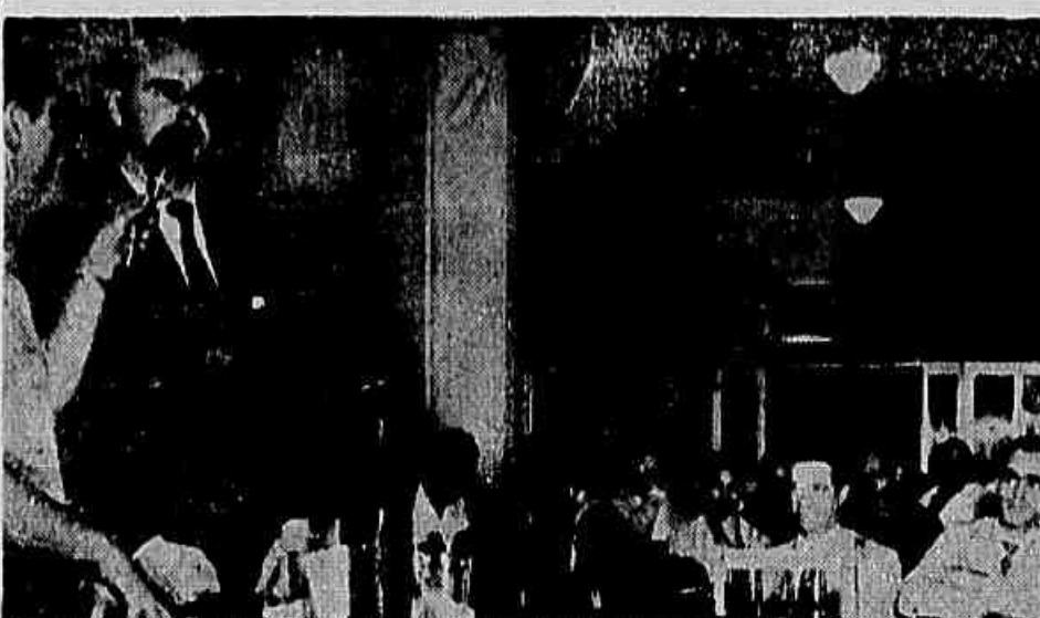
Aspecto da assembléia dos padeiros, na qual foi iniciada a campanha salarial, vendo-se o deputado federal Fernando Ferrari, quando usava da palavra, apoiando as reivindicações dos trabalhadores

O presidente do SAPS concederá uma entrevista coletiva, hoje, à tarde em seu gabinete, quando falará sobre as diversas irregularidades que vem sendo denunciadas pelos jornais.