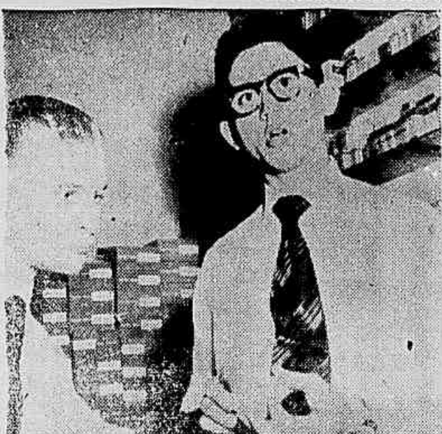
O gerente da Farmácia Rio Branco, quando prestava declarações ao repórter da IMPRENSA POPULAR

O leite, certamente, será a «bomba» da reunião de amanhã, pois os produtores ameaçam um «lock-out» se o aumento não for concedido.