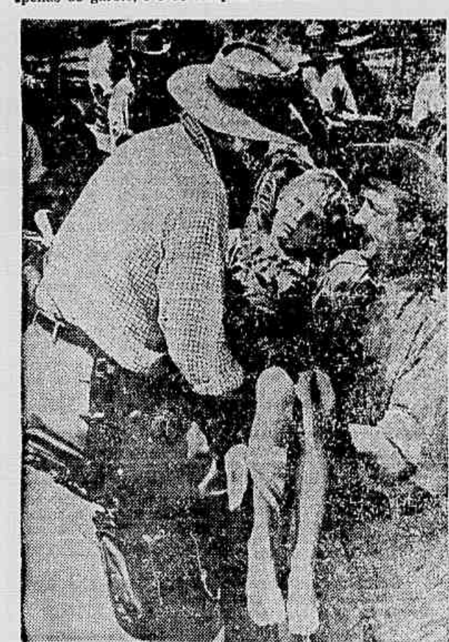
O RISONHO nos braços do sargento numa cena de JOGOS DA VIDA