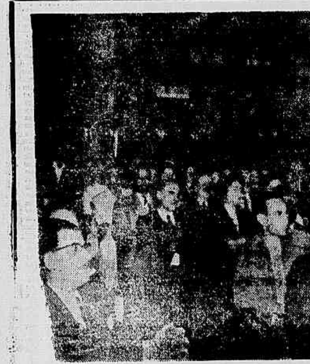
Assim, a Casa do Jornalista associa-se às homenagens que vêm sendo prestadas a Villa Lobos, em todo o país, pela passagem de seu 70.º aniversário natalício.