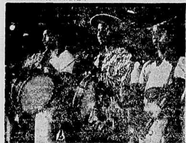
Mem nos trechos do espetáculo musical Banzo-nô — encenados em Brasiliana — conseguem quebrar a monotonia do filme

Dos diversos filmes no gênero que já foi dado assistir Brasiliana é, sem dúvida, o mais fraco não podendo sequer ser comparado com o ambicioso e frustrado O samita fantástico, onde havia fotografia da equipe de Jean Manzon e uma bonita partitura. Se comparado ao documentário italo-brasileiro Magia Verde ainda mais se acentuam o contraste — pois em Magia Verde a cor e a cuidadosa montagem de imagens realmente créditos para nós não admitem paralelo.