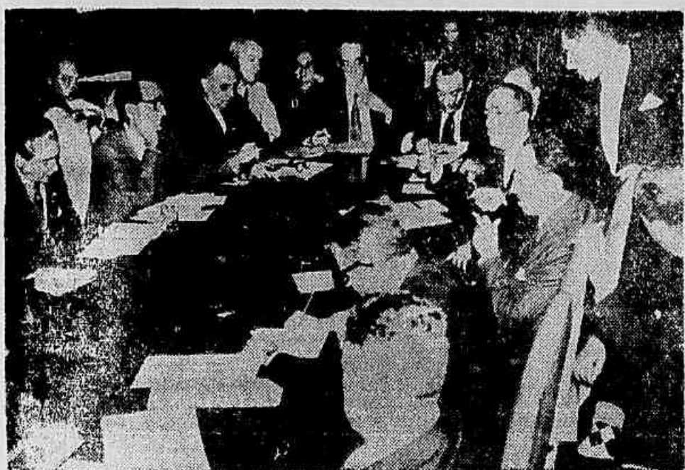
Aspecto da mesa-redonda de ontem no Tribunal Superior Eleitoral

Será feita nesse sentido uma intensa campanha publicitária através do rádio, da imprensa e da televisão — 300 milhões de cruzeiros para ajudar ao eleitor na exigência da fotografia — Cada vez mais necessário restituir a legalidade ao Partido Comunista do Brasil