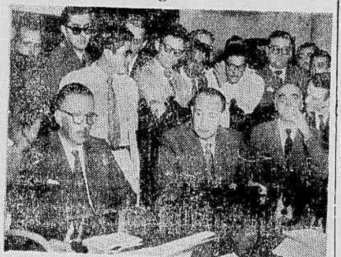
Banqueiros lado a lado com bancários, ontem, na audiência de conciliação