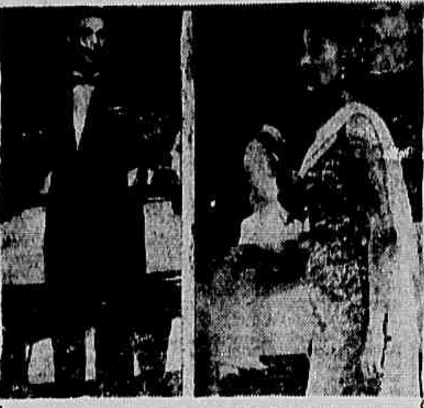
Dentro em breve teremos nas telas dos cinemas cariocas o filme «Maluco por mulher», onde entre outros «astros» e «estrelas» teremos oportunidade de ver Zé Zé Gonzaga e Luis Claudio. Este último fazendo sua estréia na cinematografia nacional. Nas fotos acima, os dois consagrados artistas durante a filmagem.