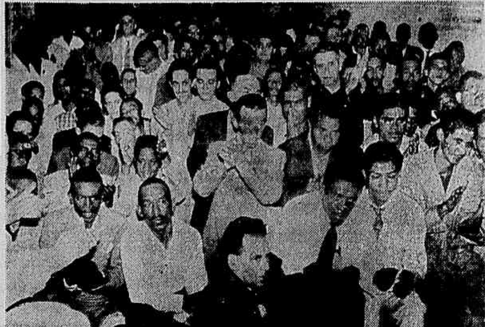
Dois aspectos da assembleia: parte dos associados presentes (mais de 1.000 compareceram) e a mesa que presidiu os trabalhos