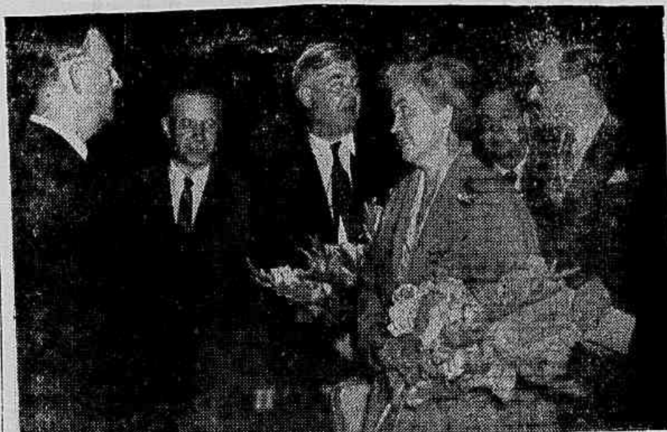
Convidado por um grupo de deputados do Soviet Supremo da URSS, o deputado Aneurin Bevan e sua esposa, Jenny Lee, chegaram a Moscou no dia 11 deste mês. O tesoureiro do Partido Trabalhista inglês manteve várias entrevistas com dirigentes soviéticos, inclusive com Kruschiov. Na foto, um aspecto da chegada de Bevan e senhora