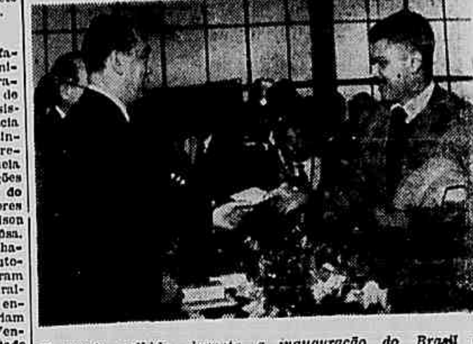
Flagrante colhido durante a inauguração do Brasil no Parque Ipirapuera, em São Paulo

BONN, 23 (FP) — Uma tragédia marítima acaba de se verificar em pleno Atlântico. O veleiro alemão PAMIR, apunhado pelo furacão "Carrie", socobrou a 550 milhas ao largo dos Açores. Após uma série de informações, procedentes de diversos pontos, falando sobre as dificuldades em que se estava vendo o veleiro, um despacho de Lisboa anunciou, segundo informação de Ponta Delgada, que o PAMIR era considerado perdido. A informação elucidava que os navios "President Taylor" e "Pennsylvania" tinham assistido ao naufrágio, sem poderem socorrer o veleiro alemão, dada a impetuosidade do furacão. De posse dessa e de outras notícias, a companhia proprietária do "Pamir", Fundação Páris e Passat de Hamburgo, anunciou que o navio e sua tripulação inteiramente deviam ser considerados como perdidos. O furacão "Carrie", no qual foi envolvido o "Pamir" altera a velocidade atingida às 15 horas, de domingo, nos Açores, 160 quilômetros por hora. O furacão era acompanhado de violentas quedas de granizo. O "Carrie" foi rasado pela primeira vez no