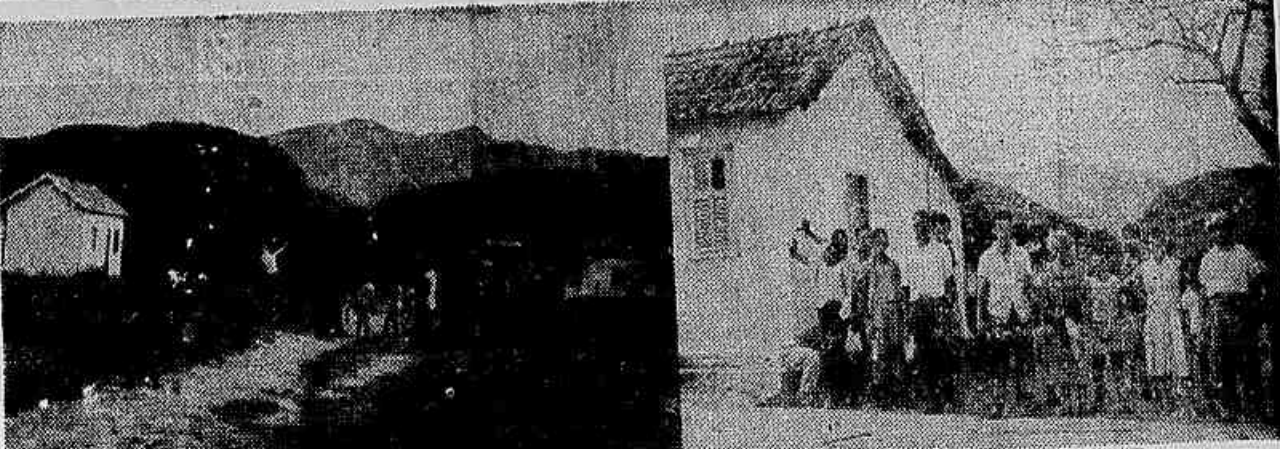
A esquerda, sitiantes mostrando ao nosso repórter as plantações. A direita, barreira humana, para impedir a invasão dos policiais e serviço da grilagem

Em relação com o transcurso do 37.º aniversário da fundação do Partido Comunista do Uruguai, Luiz Carlos Prestes endereçou ao Comitê Executivo daquele Partido, o seguinte telegrama: «Comitê Executivo do Partido Comunista do Uruguai. A Rodney Arismendi, Montevideu, Uruguai. Em nome dos comunistas brasileiros, envio calorosas saudações ao Partido Comunista do Uruguai pela passagem do seu 37.º aniversário. Associando-nos às comemorações da data de 20 de setembro, desejamos que se estreitem ainda mais os laços de solidariedade entre os partidos comunistas e os povos dos dois países. Nossos votos são para que o Partido irmão alcance novos êxitos na luta contra o imperialismo comum — e em defesa das liberdades e pela emancipação do Uruguai. (a) LUIZ CARLOS PRESTES».