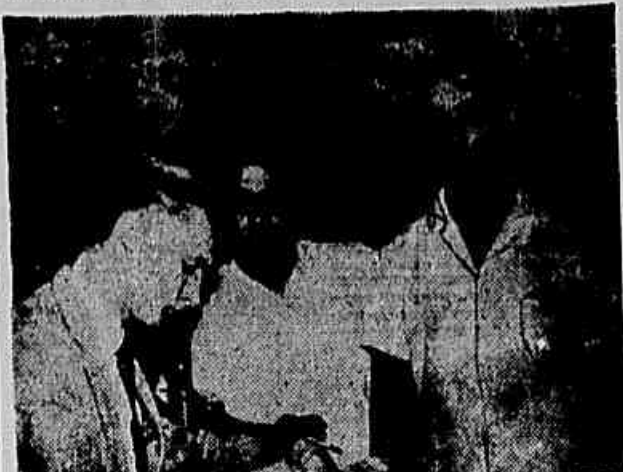
Açougueiros da casa "União", falando ao repórter da IMPRENSA POPULAR

E' quando um surto de gripe ataca a cidade fazendo mais de 60 mil vítimas, e as autoridades aconselham o carioca a «comer bem», que a população está ameaçada de ficar sem carne verde totalmente de uma hora para outra. Os frigoríficos... (CONCLUI NA 3ª PAG.)