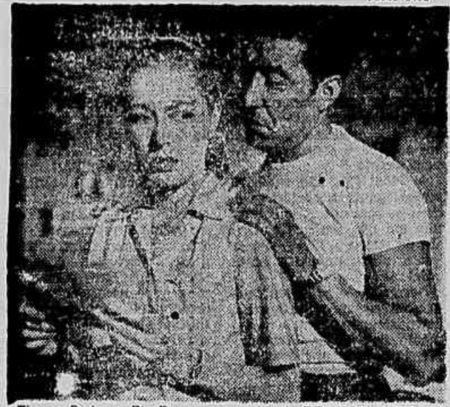
Eleanor Parker e Ric Roman numa cena de DESEJOS OCULTOS