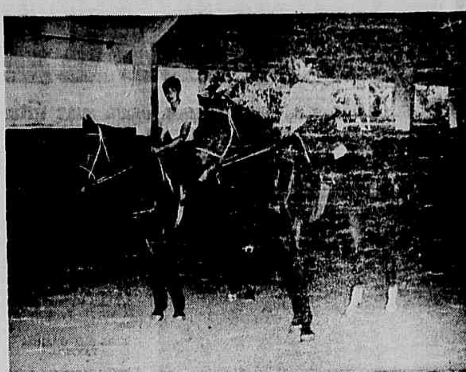
Dois aprendizes no "picadeiro" durante uma aula prática

Em suma: a Escola de Aprendizes é uma realidade!