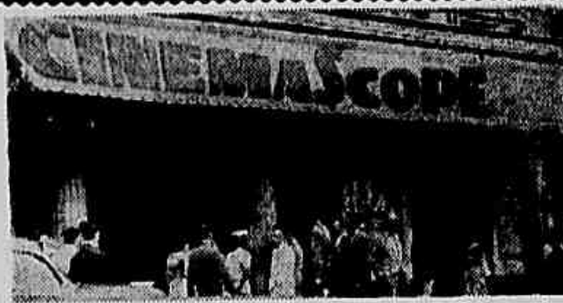
A Justiça decidiu ser legal o tabelaamento pela COFAP, frustrando, assim, o plano dos exibidores, de majorar os ingressos

greve que realizaram há anos passados. A respeito desta campanha que começará com a assembleia de hoje, nossa reportagem (CONCLUI NA 2ª PAG.)