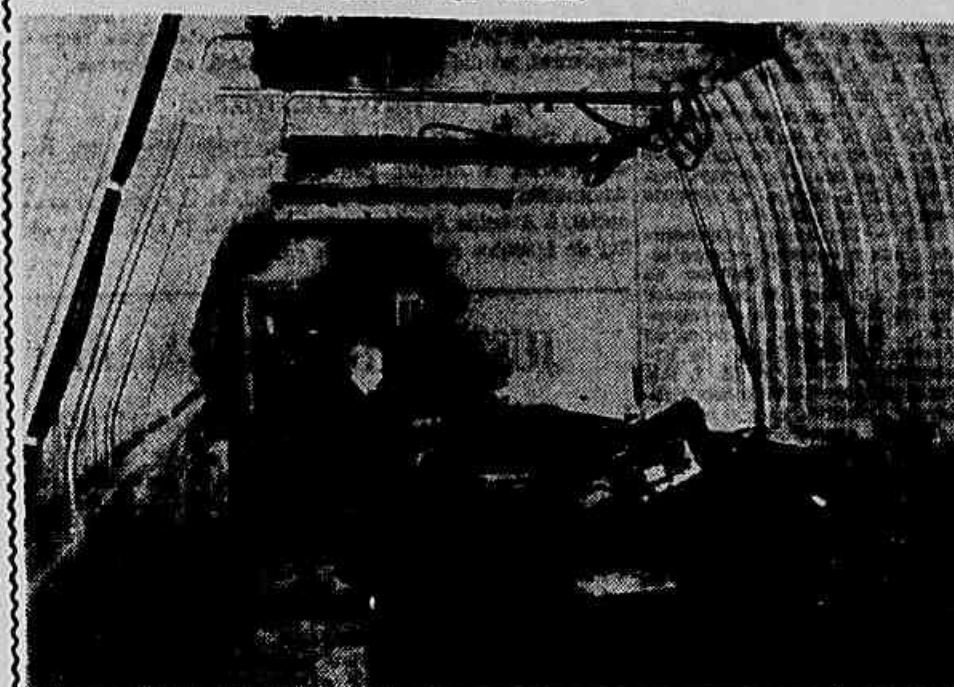
ESTUDO DOS RAIOS COSMICOS — Foi construído, na Colina Lenin, em Moscou, um centro para o estudo da incidência dos raios cósmicos, o qual será transferido, em breve, para o Instituto de Física da Universidade de Moscou. O Centro consiste em 15 laboratórios que registram, simultaneamente, a incidência dos raios cósmicos. Todas as radiações são controladas por dois painéis. Estas pesquisas tornaram possível tirar importantes conclusões, concernentes às características da interação nuclear de altas energias, que, no presente, não podem ser obtidas num laboratório. No clichê cientistas estudam dados experimentais. (Especial para IMPRESA POPULAR)

cializados em várias profissões, durante este ano e no decorrer do ano de 1958. Tratoristas, choferes de caminhão, mecânicos de máquinas agrícolas e eletricitistas serão treinados com a ajuda de técnicos soviéticos.