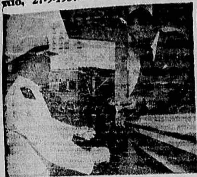
O presidente da República quando fazia entrega do prêmio ao primeiro alho Rui do Sousa Candia