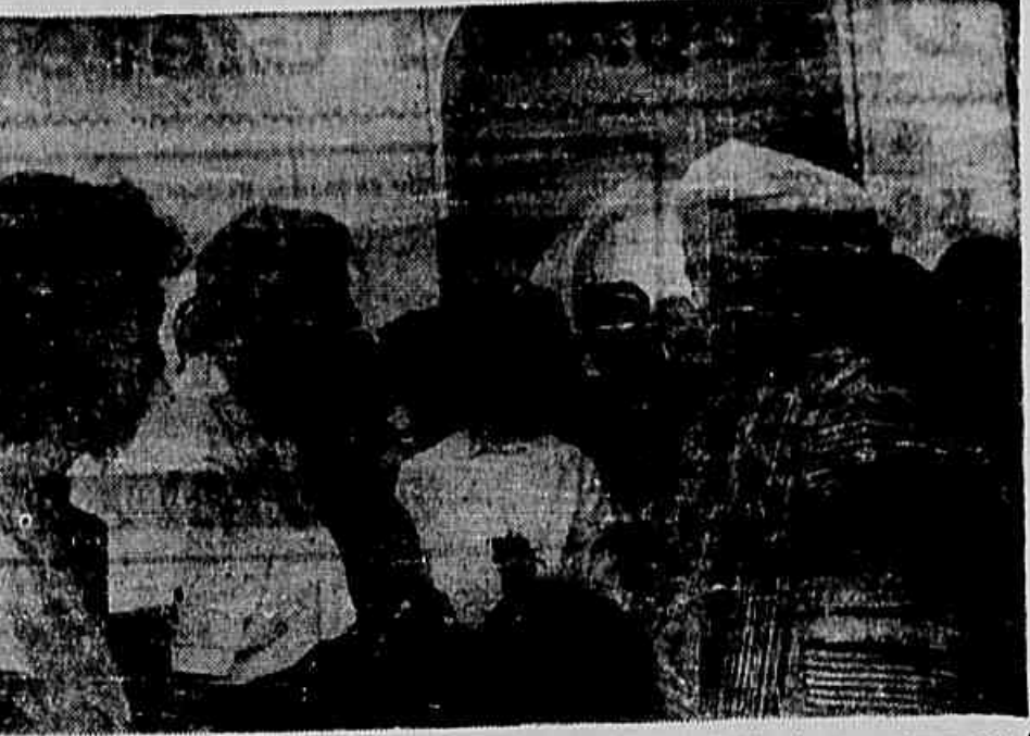
Eleanor Roosevelt na U.R.S.S. — Realizando uma viagem turística pela União Soviética, a senhora Eleanor Roosevelt visitou a cidade de Tachkent, capital da República do Quirguistão. No clichê, vê-se a viúva de Franklin Roosevelt em palestra com Zlatimir Babaranov, chefe Central.

Com traumatismo craniano, o acidentado, que é filho do coronel Bertuel, foi medicado no Hospital do Pronto Socorro, onde, em estado gravíssimo