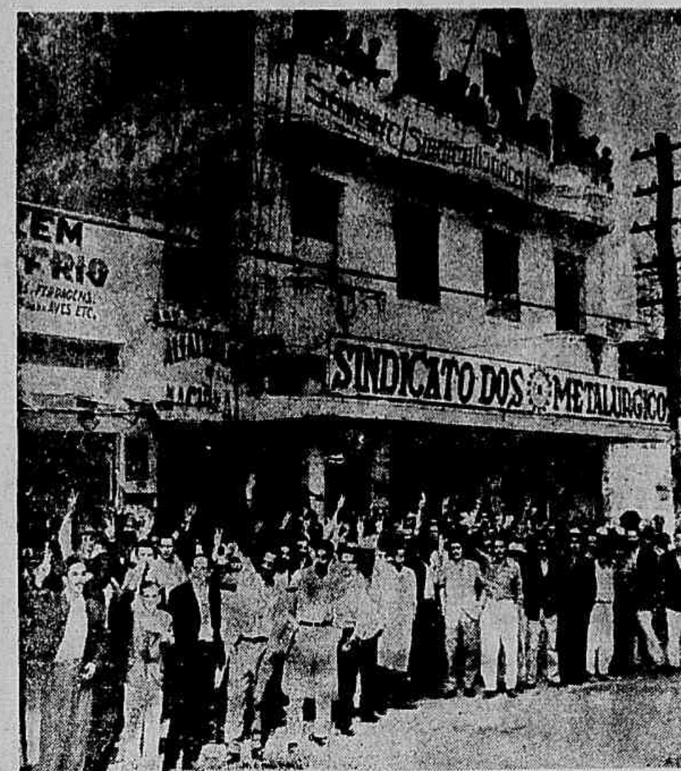
Os metalúrgicos de Volta Redonda, agora empunhando em nova luta por aumento de salários, têm uma tradição de firmeza e combatividade. O clichê recorda a grandiosa batalha que sustentaram e tornaram vitoriosa, contra a intervenção ministerial em seu sindicato. Centenas de trabalhadores permaneceram, de madrugada, dia e noite de guarda em frente à sede da entidade, para impedir que a mesma fosse ocupada.

Reivindicam aumento salarial junto à CSN — Intensa movimentação no sindicato — Apoio aos grevistas de São Paulo — Também os trabalhadores em construção civil de prontidão