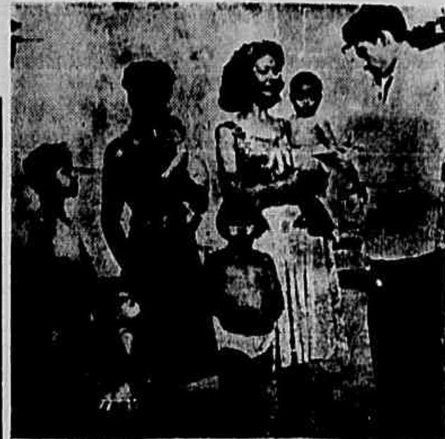
Na foto, moradores quando lavavam a roupa em

Todos os moradores do Bairro Sassi, através da IMPRENSA POPULAR, dirigem apelos às autoridades municipais, no sentido de que tenham tomado providências para um pronto atendimento, pois pagam de um modo geral os mesmos impostos que os outros habitantes da cidade.