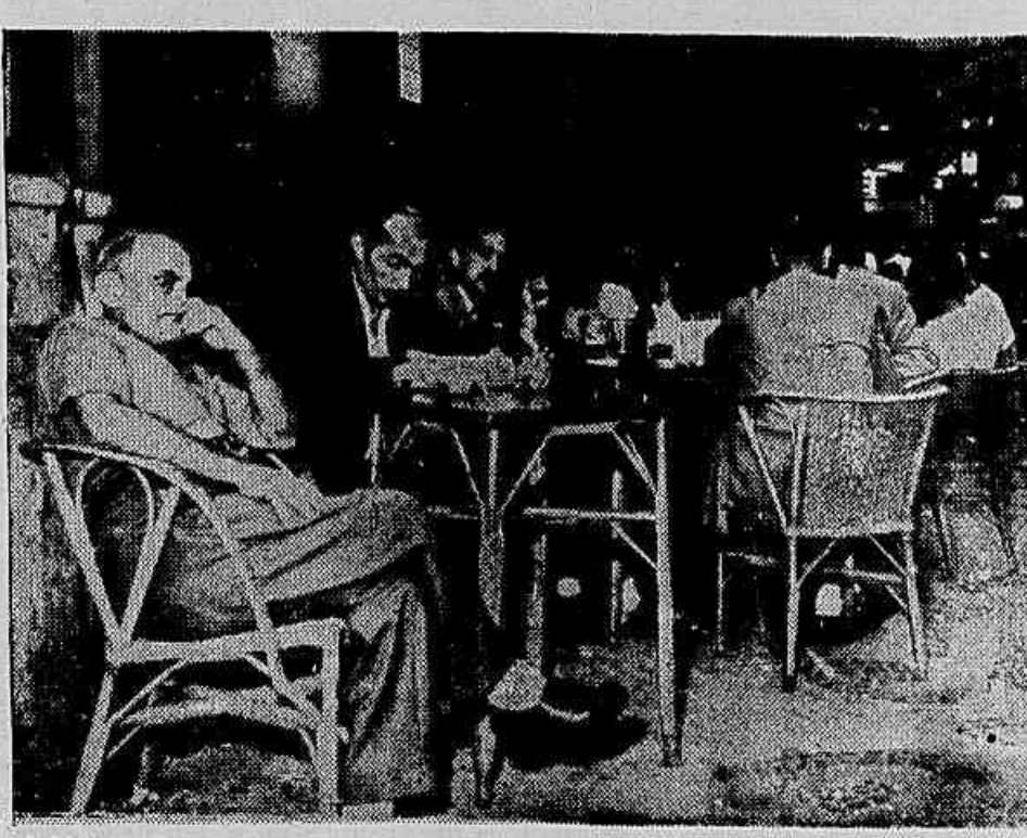
A fauna da Galeria resiste silenciosamente à demolição iniciada. Muitos desses, há vários anos gravitam, como satélites de carne e osso, em torno da "NAB" e das tendinhas ali existentes

Hotel Avenida. Enquanto os operários vão colocando as tábuas, os últimos "habitantes" da NAB resistem pacíficos e silenciosamente, atrás de uma pilha de cartões, num protesto mudo e aquático contra o crime que se perpetra contra as tradições e contra o patrimônio da Prefeitura.