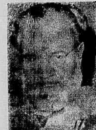
O sr. Barão de Itararé

O Barão de Itararé foi lançado na TV-Rio sob o satélite e outros assuntos transcendentais. Que acha do satélite russo? — perguntou-lhe uma