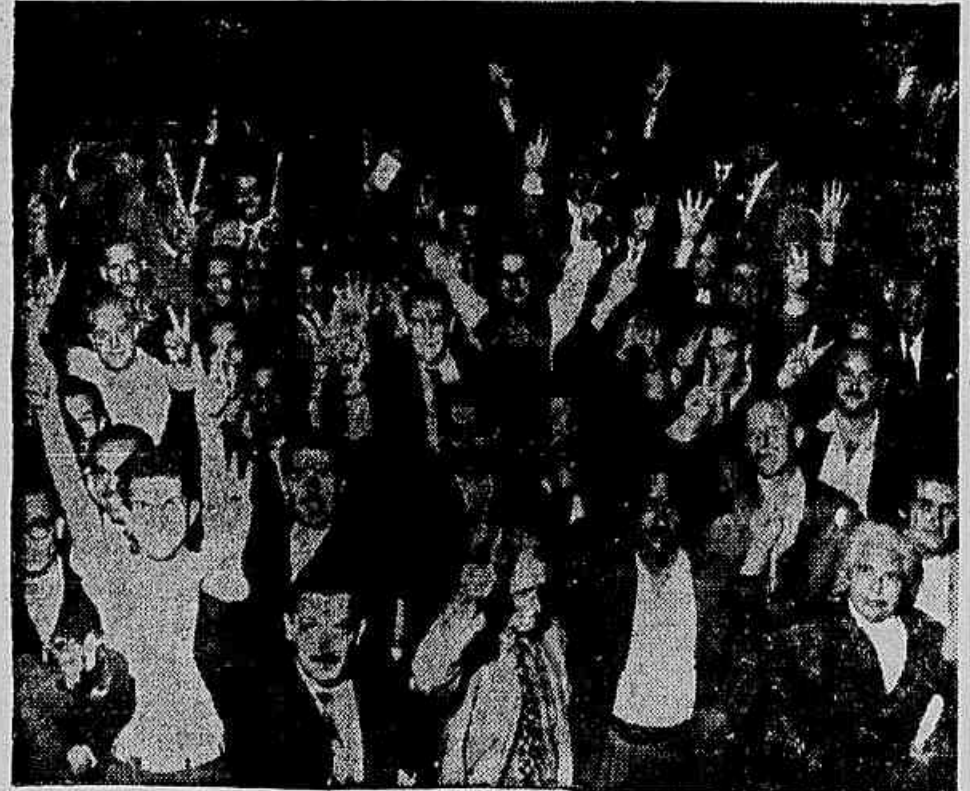
Em todas as assembleias das categorias em greve, os trabalhadores têm reiterado a sua disposição de não retornar ao trabalho sem a vitória. No clichê, flagrante de uma dessas reuniões