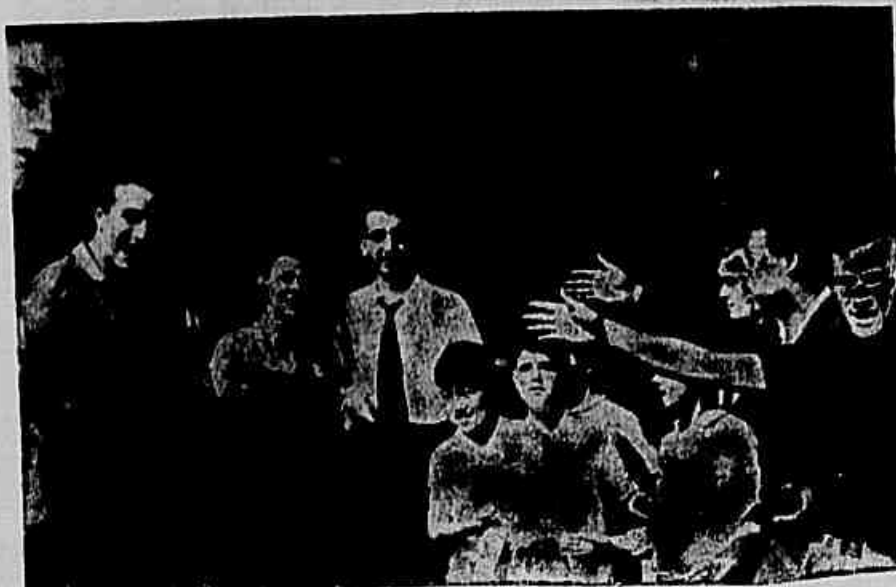
Nas febreiras, os piquetes de greve são recebidos com o mais vivo entusiasmo. Cada visita é mais uma vitória para a luta sindical. O movimento prossegue com todo o seu ímpeto. Os trabalhadores só retornarão quando suas reivindicações forem atendidas.

INTRANSIGENTES OS INDUSTRIAIS, CONTINUA A GREVE