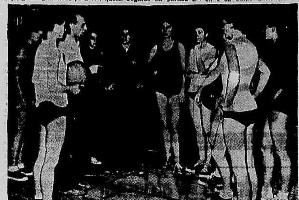
Jogadoras da União Soviética em ação durante a partida. A URSS é a favorita no grande cotejo de hoje contra as brasileiras.

A torcida terá, na noite de hoje, grandes motivos para vibrar com as seleções do basquetebol. Jogarão na partida final a seleção brasileira e a da União Soviética.