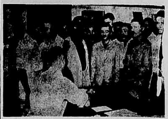
A foto acima é da Comissão dos trabalhadores da Construção Civil que visitou nossa redação