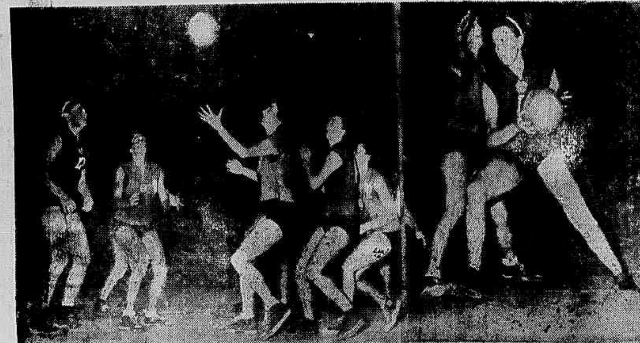
FÁCIL TRIUNFO SOVIÉTICO — Duas partidas assinalaram a rodada de ontem do II Campeonato Mundial Feminino de Basquetbol. A primeira reuniu as representantes do Chile e do Paraguai, saindo vitoriosas as paraguaias por 56 a 43. No jogo principal defrontaram-se os «lives» da União Soviética e da Hungria. As moças da URSS, confirmando seu favoritismo, abateram as húngaras por 64 a 53, devendo-se destacar a reação final das magras, que reduziram bastante a diferença do placar. Um gesto da equipe soviética que comoveu o público presente (renda de 58.255 cruzeiros) foi o lançamento de flores sobre a «torcida», que retribuiu com carinhosos aplausos. Na primeira foto vemos quatro jogadoras da Hungria, quando tentavam «segurar» a bola e na segunda a vitória soviética, ao tentar passar por duas adversárias.

Importantes declarações do deputado José Joffily sobre a crise econômica que paralisa o desenvolvimento do nordeste — Sisal, algodão e minérios enriquecem a SAMBRA E ANDERSON CLAYTON e agravam a miséria de 15 milhões de nordestinos — Generosidade federal não resolve mais, e sim a industrialização das matérias-primas da região