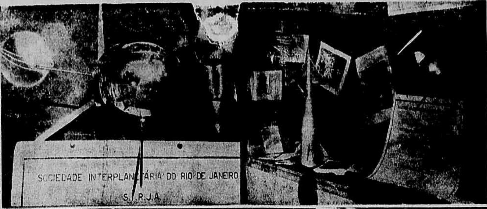
SOCIEDADE INTERPLANETÁRIA DO RIO DE JANEIRO S. R. J. A.

Exposição sobre o Satélite Foi desafiado grande interesse no povo carioca a Exposição de Astronomia e Astronáutica, que a Sociedade Interplanetária do Rio de Janeiro está promovendo numa vitrine da Livraria Freitas Bastos. Diariamente, é grande a quantidade de pessoas que constantemente se reúnem diante da vitrine, para admirar e fazer comentários sobre o assunto por ela focado. Nas fotos acima, vemos, da esquerda para a direita: 1) o modelo de um satélite artificial; 2) livro de astronomia; o modelo de um foguete interplanetário e novamente o modelo do satélite.