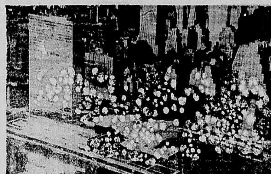
Visão aérea da sede das Nações Unidas, localizada na ilha de Manhattan, Nova Iorque. No prédio baixo que se vê à esquerda, encimado por uma cúpula, reúne-se atualmente a 12ª sessão da Assembleia Geral, com a participação de representantes de 82 Estados

Seu principal órgão, previsto na Carta são o Conselho de Segurança, encarregado de manter a paz entre as nações e composto de 11 membros, 6 permanentes e 5 eleitos; Conselho Econômico e Social cuja atribuição é a de promover a cooperação econômica, social, cultural e científica, estimular o respeito à liberdade e direitos humanos sem distinção de raça, sexo, religião ou idioma. A ONU não é um super-estado ou um super-governo. Não legisla, e apenas um instrumento por meio do qual os diversos governos podem cooperar mutuamente.