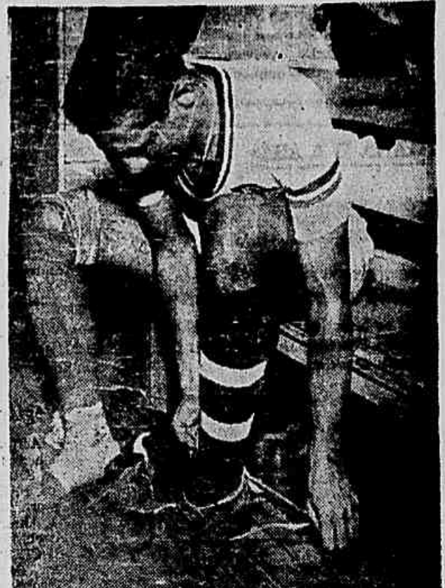
Pinheiro fará um teste hoje para saber se poderá jogar contra o São Cristóvão

Julinho foi submetido a um tratamento energético e os dirigentes da "Florentina" desejam que ele se restabeleça rapidamente, porque acham que sua presença, na ala direita da equipe, será determinante no encontro a ser disputado contra os napolitanos.