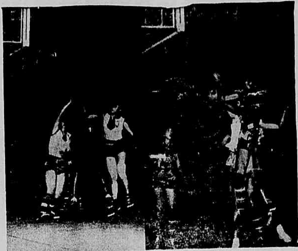
No clichê acima vemos um momento emocionante de jogo entre americanas e tchecas e ao lado: (a) um grupo de jogadoras tchecas; (b) jogadoras soviéticas na quadra, em um intervalo do jogo