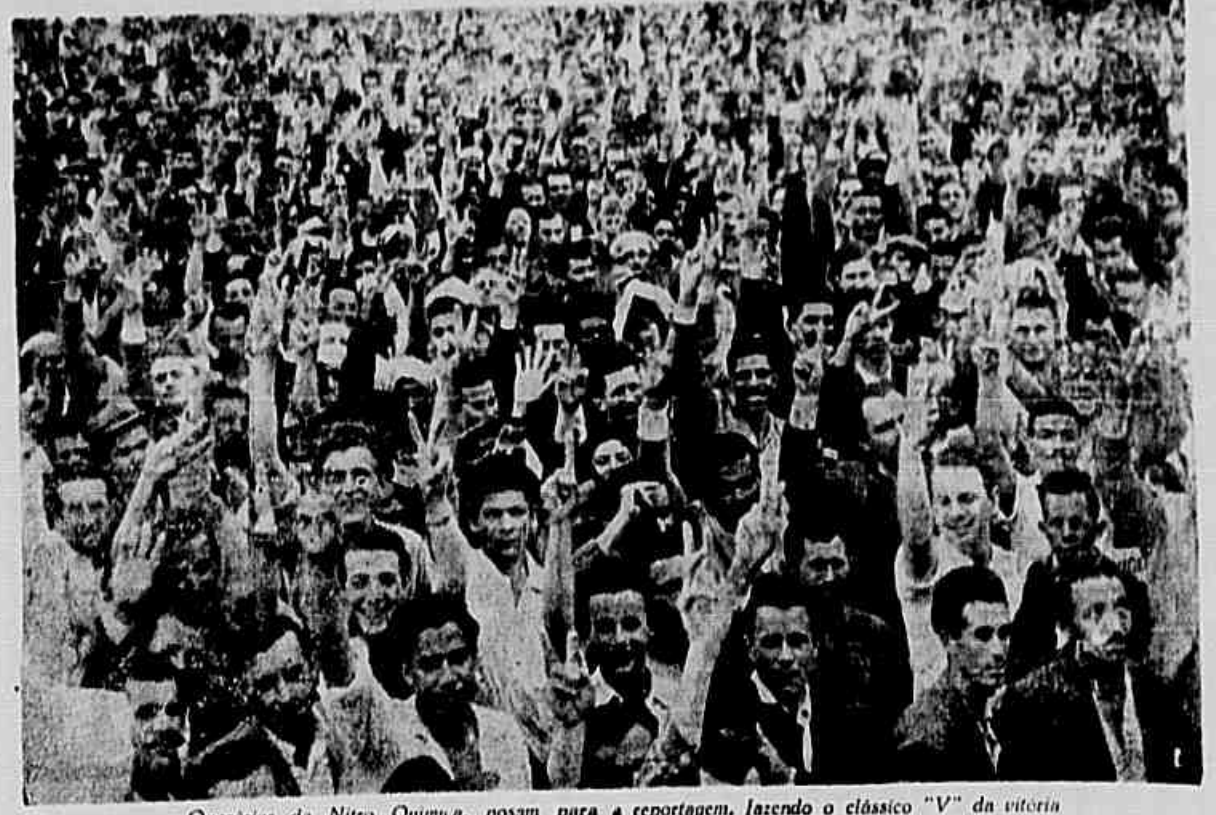
Operários da Nitro Química, posam para a reportagem, fazendo o clássico "V" da vitória