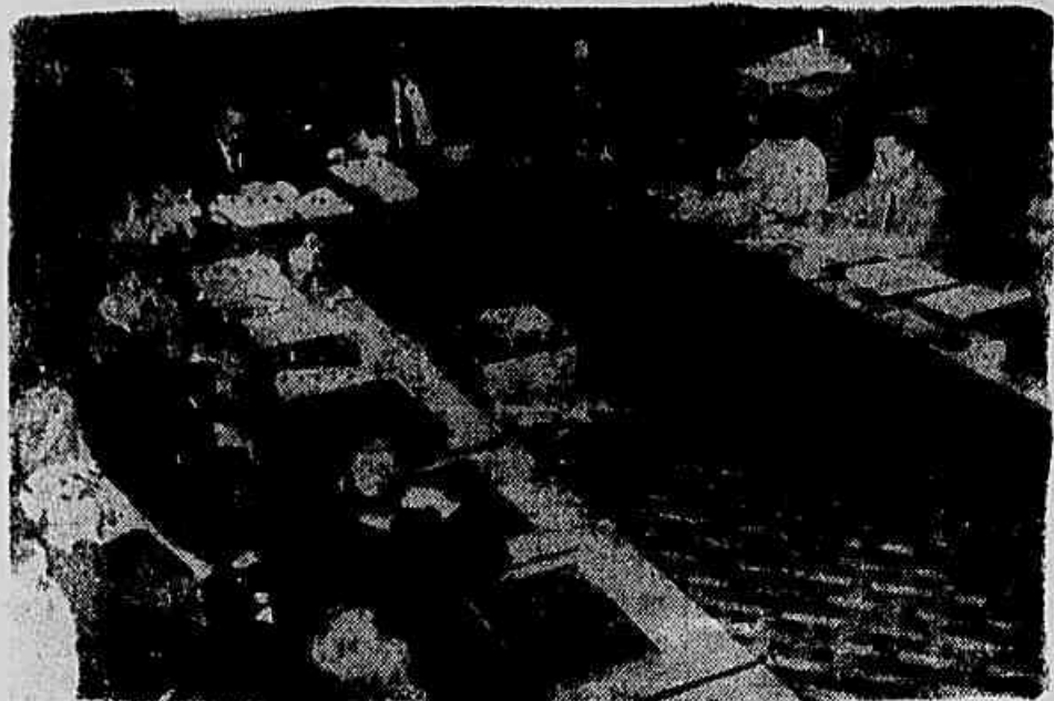
A Comissão BESO-SHELL, após apanhar de um relatório de ontem, quando constatou estar sendo infiltrada pelos representantes dos trustes petrolíferos