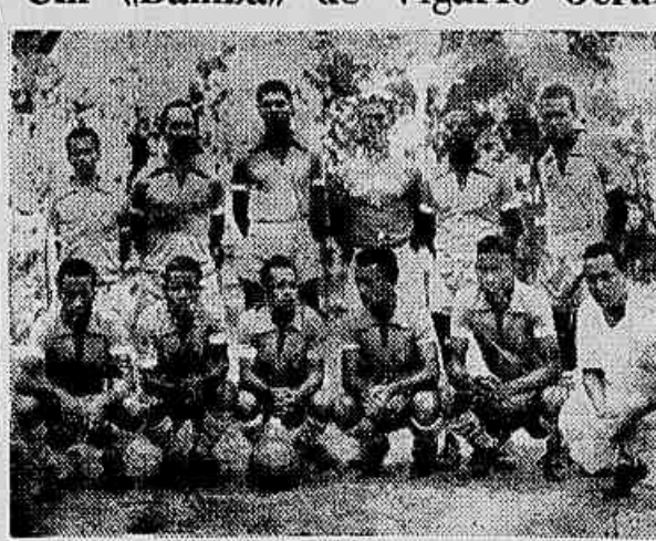
O subúrbio de Leopoldina conta com centenas de bons quadros, que defendem o prestígio do "soccer" amadorista Independente da Zona. Dentro deles se encontra o Vigário Paredense, agremiação recém-fundada que já conta em sua actuação de glórias com inúmeros troféus e laureis que honram qualquer agremiação. Na foto, a apresentação do Vigário Paredense.