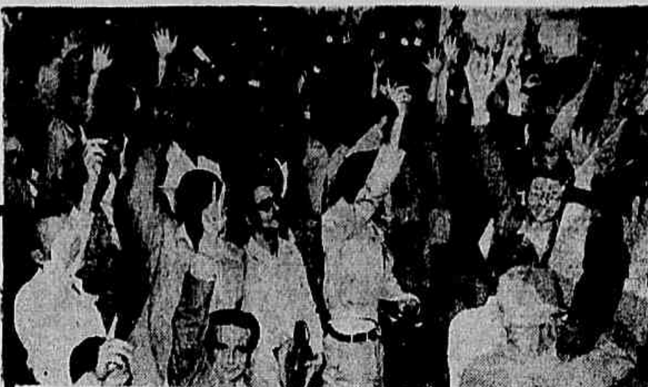
Na foto: uma expressão de demonstração dos trabalhadores, simbolizando a conquista do aumento com o já célebre V da vitória. Texto na segunda página.