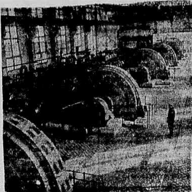
DISTILARIA DE ALCOL SINTÉTICO — Em Saratov, na União Soviética, foi montada uma distilaria de álcool sintético, que utilizará subprodutos gasosos da refinação do petróleo (sobre tudo o eteno) para produzir álcool etílico. Na foto, a câmara compressor da seção de produção do gás.

O superávit de trigo produzido, em relação às necessidades atuais de consumo, é de 410.000 toneladas.