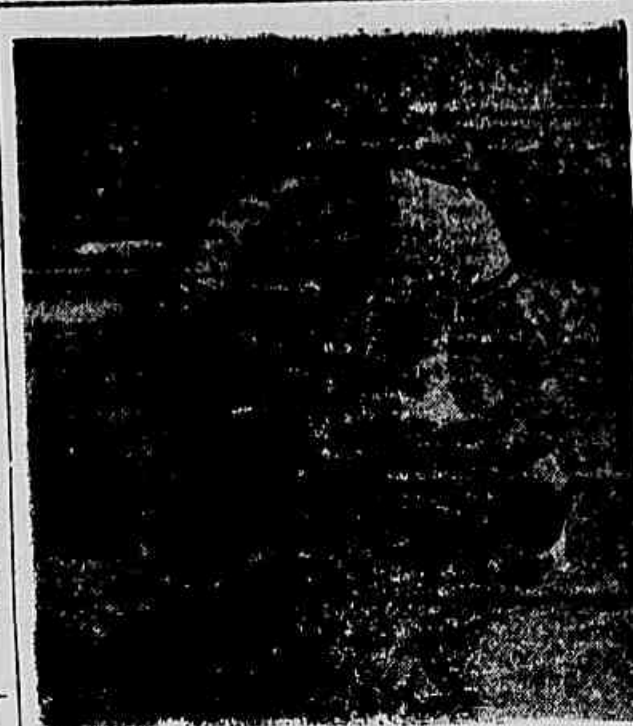
O zagueiro Edson da América. São poucas as possibilidades de seu reaparecimento, amanhã, contra o Fluminense