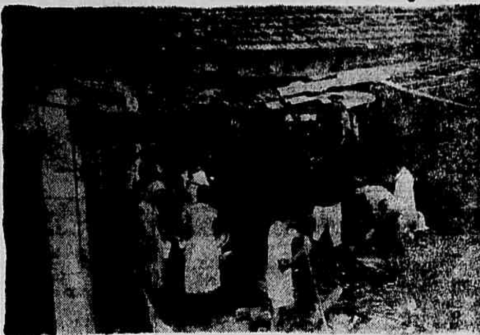
A ruína da casa da adutora de Ribeirão das Lages, na manhã de ontem, na Rua Couto Magalhães, destruída modestas casas de trabalhadores, afundando-se no relento, juntamente com suas famílias, como se pode ver pelo flagrante acima, colhido quando as vítimas da irresponsabilidade do Departamento de Águas e Esgotos procuravam salvar os seus poucos pertences. (Reportagem na oitava página.)

Destruídas as Casas Pela Torrente D'água