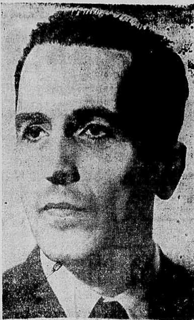
LUIZ CARLOS PRESTES

Destruídas as Casas Pela Torrente D'água