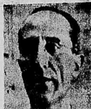
Senador Domingos Veloso

Parlamentares falarão em ato público na ABI, amanhã