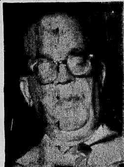
General Caiado de Castro

— Sou radicalmente contrário, e isto é de todos conhecido, às idéias marxistas. Mas sempre entendi que o PCB, como qualquer outro partido, deveria atuar legalmente. Se assim penso, não tenho como manifestar restrições a que o líder comunista saia da clandestinidade em que se acha e, como qualquer cidadão, participe livremente da vida política nacional.