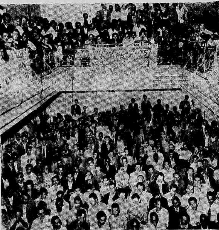
Um aspecto da grande assembleia dos aeroviários que aprovou por unanimidade a declaração da greve