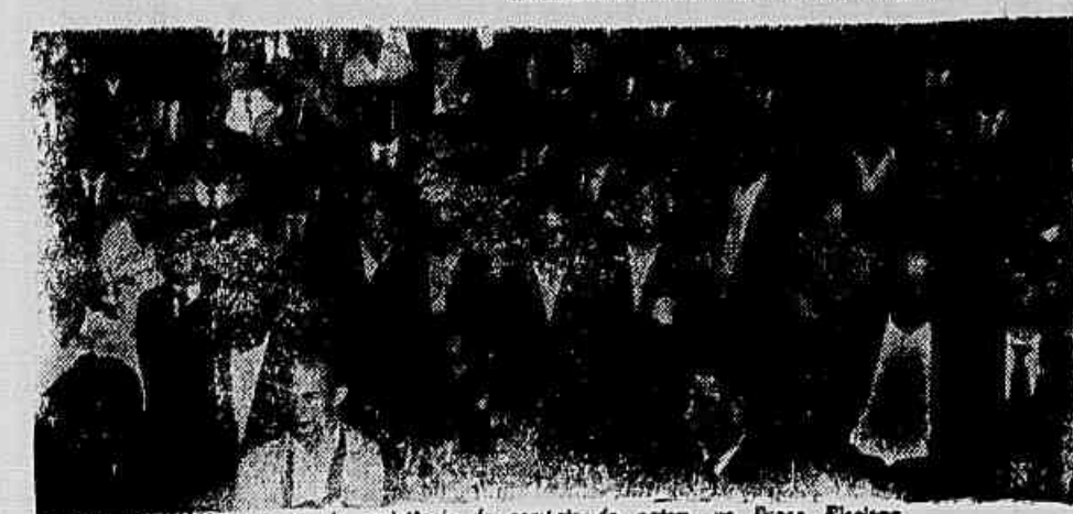
Um momento da manifestação de respeito às armas, no Praça Floriano

Graças à atitude patriótica das forças armadas, foi mantido o respeito aos postulados democráticos da Constituição