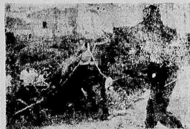
Em virtude do péssimo estado de conservação em que se encontra a Rua Lúcia, essa categoria atou-se num buraco, exigindo bastante tempo e esforço para que dali pudessem ser retiradas.

— Há dois meses, não caia uma gota d'água em nossas casas, muito embora a adutora do Distrito nasce dentro do Município. Atendendo aos nossos protestos, o Prefeito Domingos Correia da Costa designou alguns homens para consertarem a canalização. No fim de dez dias, verificamos que não havia um só cano na rua! Pômos, em comissão, ao gabinete