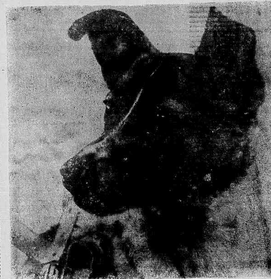
Nessa fotografia, fornecida pela Agência Tass à IMPRENSA POPULAR, vemos Laika, o animal jogado a 1.500 quilômetros de altura, com o Sputnik II. Telegramas vindos agora de Moscou informam oficialmente que Laika morreu, desde quando o segundo satélite deixou de emitir. Para abreviar o sofrimento desse animal sacrificado em benefício da ciência e do progresso da humanidade, o animal não tem sido mais mencionado em notícias.

MOSCOU, 12 (RM) — Começou na península de Kamchatka a construção de uma usina de energia elétrica, que explorará a energia dos vulcões abertos. A central utilizará a energia das fontes vulcânicas que da região do lago Kurilekoye.