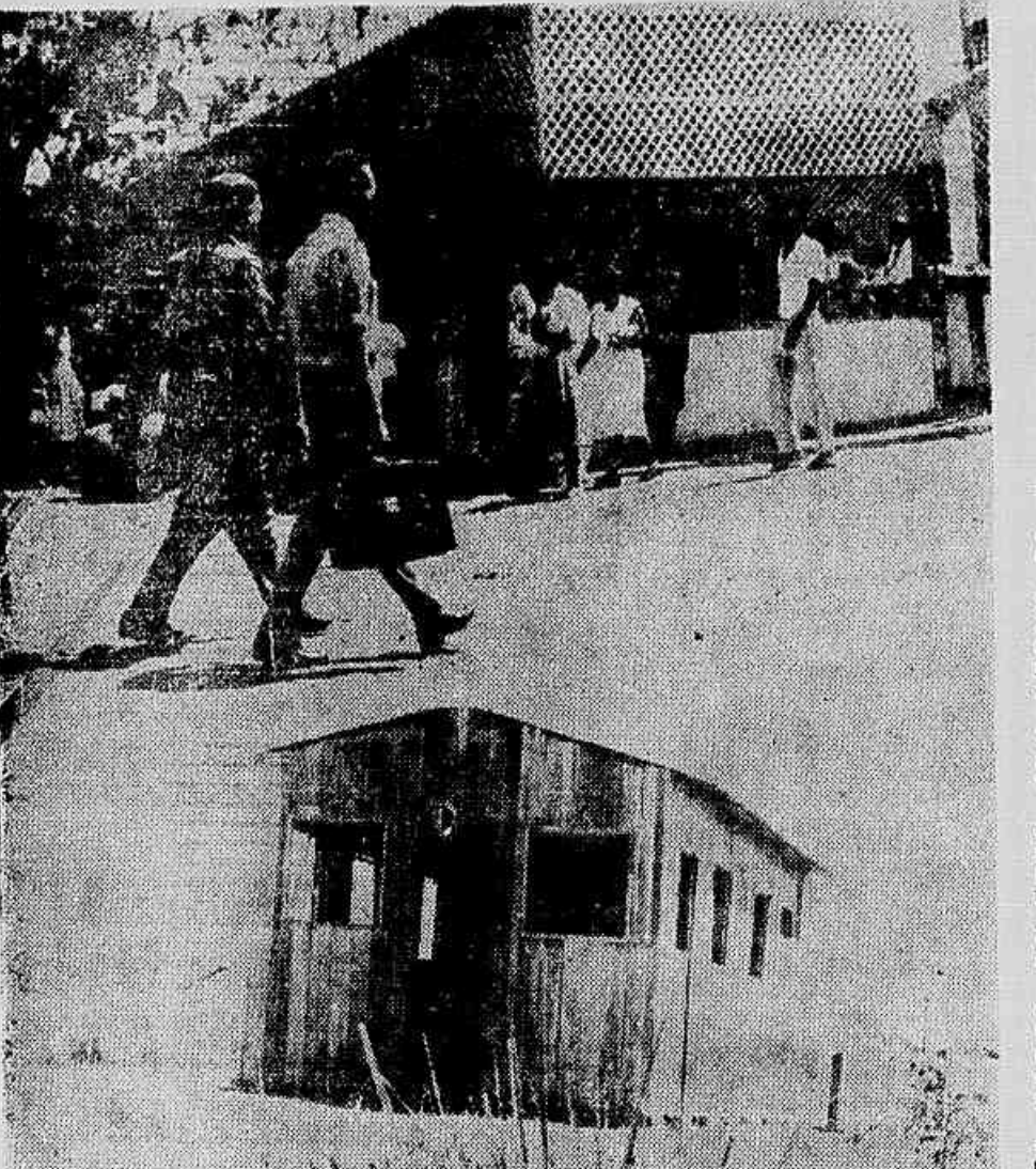
A feira permanente de Caxias oferece bons e variados produtos agrícolas. Os consumidores formam filas constantes, a procura é sempre grande, embora os preços não sejam os melhores.

Para esta reunião estão convidadas todas as pessoas interessadas. A entrada será franca.