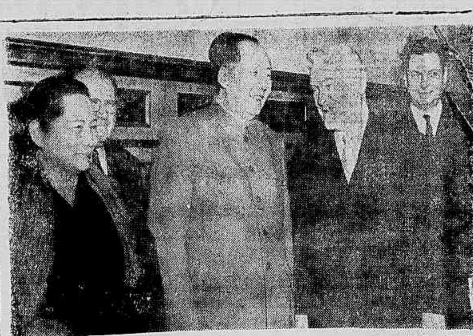
BULGANIN E MAO TSE TUNG palearam no Kremlin, quando o presidente do Conselho de Ministros da URSS recebia a delegação chinesa às festas do 40.º aniversário da revolução soviética. O encontro dos dois estadistas verificou-se a quatro dias de hoje.

não poderão desrespeitar impunemente os representantes do povo brasileiro. (Texto na 2ª pag.)