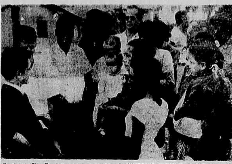
Aqui, disseram os moradores ao repórter, existia, outrora, uma boa água. Mas foi retirada pela Prefeitura, sem que se saiba o motivo.