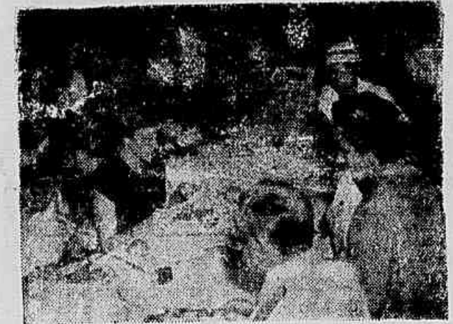
HOMENAGEM AO CHEFE DO E.M.E. — Realizou-se ontem, no Luzor Hotel em Copacabana, o almoço oferecido pelos adidos militares dos países acreditados junto ao governo brasileiro ao general Zeno Estilao Leal, chefe do Estado-Maior do Exército. Participaram do almoço oficiais superiores do E.M.E. e outras autoridades militares. Na foto aspecto da homenagem.

MUNDO. Provocou excepcional interesse no Congresso a película apresentada pela delegação soviética sobre o transplante do coração nos animais de sangue quente. A pedido dos cirurgiões médicos de Washington os cientistas soviéticos fornecerão informações sobre as pesquisas realizadas na URSS no campo das doenças cardiovasculares.