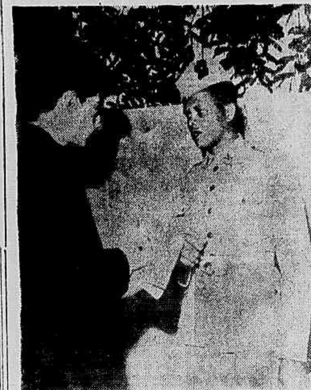
O fuzileiro naval falando ao repórter da IMPRENSA POPULAR

Para o mesmo endereço deverão ser enviados os trabalhos de caráter científico, literário, etc., no concurso instituído pelo jornal «Pravda», a propósito do lançamento dos satélites artificiais da Terra.