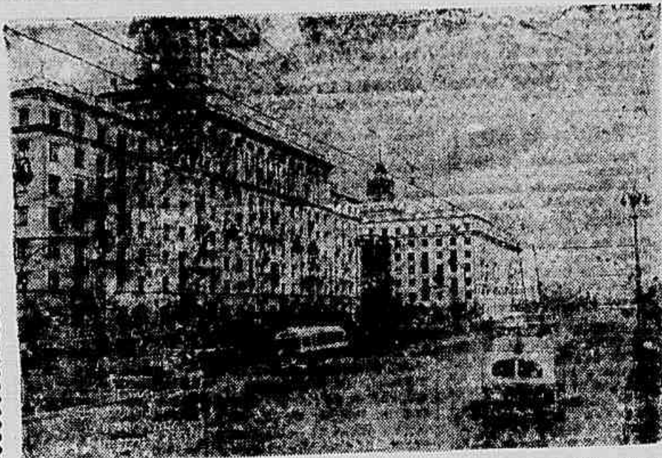
A VIDA NA URSS — Por ocasião das comemorações do 40.º aniversário da Grande Revolução, Nikita Krushchov afirmou que, dentro de poucos anos, estará completamente resolvida a questão da moradia na URSS. Sua declaração foi acompanhada por uma visita a um apartamento construído para trabalhadores, em Moscou. (Especial para IMPRENSA POPULAR)

BEIJING, 13 (FP) — Foi concluído um dicionário da língua Li, falada na ilha Hainan. Seu trabalho teve assistência de especialistas enviados a Hainan pela Academia Chinesa de Ciências. O dicionário baseia-se nos caracteres latinos. Também foram editados, na mesma língua, em caracteres latinos, livros de textos muito simples, destinados à educação das crianças.