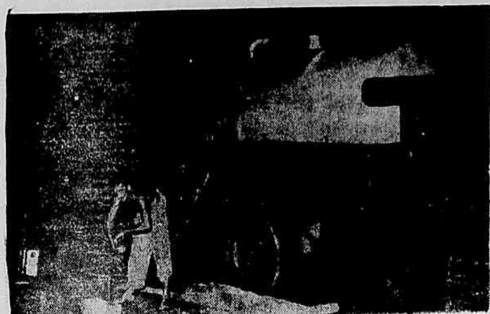
Antes, o carro-pipa do Hotel Martique, que se vê na foto, era um dos mais assíduos 'fregueses' do hidrante do Santa Galo