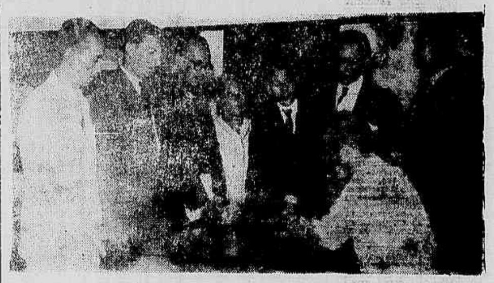
COM O FECHAMENTO de fábricas de tecelagem em Salvador, centenas de operários têxteis foram lançados no desemprego, enquanto outras centenas estão sob ameaça de perder o trabalho. A fim de entrar em entendimento com o governo federal, encontra-se nesta capital uma delegação do sindicato dos operários têxteis. Na foto, os dirigentes dos tecelões baianos quando falavam à nossa reportagem. (Leia na segunda página.)