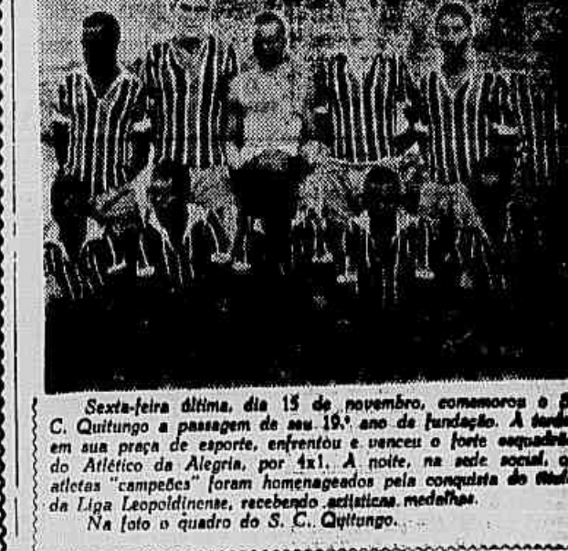
Sexta-feira última, dia 15 de novembro, comemorou o S. C. Quitungo a passagem de seu 19º ano de fundação. A tarde, em sua praça de esporte, enfrentou e venceu o forte quadruplo do Atlético da Alegria...