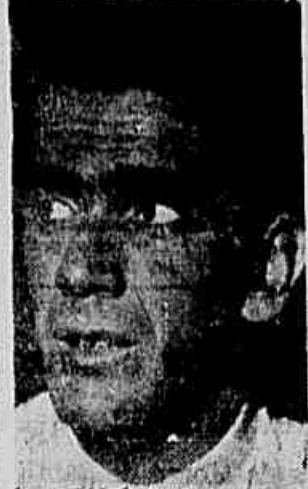
Castilho do Fluminense, cortina da goleira...