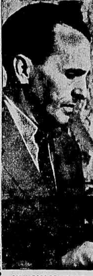
LUIZ CARLOS PRESTES

Atendendo a proposta da Diretoria de Aeronáutica Civil, o ministro da Aeronáutica assinou portaria classificando em primeira e segunda categorias os aeronaves para transporte de passageiros e passageiros. Os aparelhos considerados de primeira categoria são os Douglas "C-47", "Douglas Constellation" (L-10 e L-10B), "Douglas" (C-47, C-48 e C-49), "Douglas" (DC-3 e C-47) e "Cataлина" (DBY-3A). Os embarques indistintos de passageiros e carga somente são permitidos nos aviões de primeira categoria, modelo que também são estendidos, nos aviões de primeira categoria, a pedido do DAV. As especificações técnicas quanto à acomodação dos passageiros nos aviões mistos e a distribuição de novas unidades incorporadas às frotas, a partir da próxima reorganização das unidades aéreas, com a inauguração de uma terceira categoria deverão ser de 15 por cento na primeira categoria para aeronaves de primeira, enquanto que nos aviões que dispõem de dois níveis de "primeira classe" e "segunda", haverá um aumento de 15 por cento em favor dos passageiros da primeira. A categoria das aeronaves serão carimbadas em seu bilhete na passagem, sendo vedada a utilização de bilhete em avião de categoria diversa à que estiver indicada na passagem.