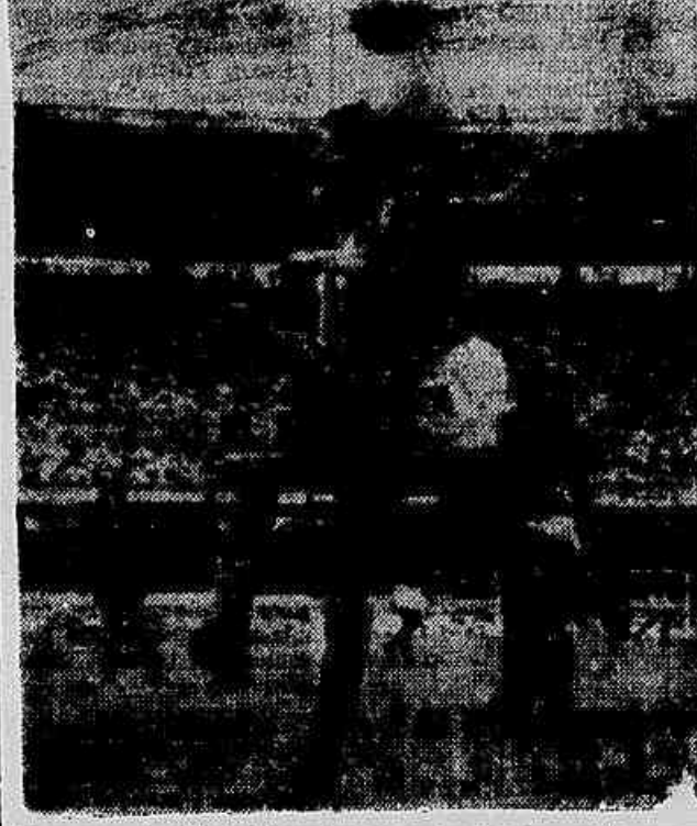
Uma cena do «clássico» de domingo entre Botafogo e Flamengo. Contra os «lusos» os botafogueses se apresentaram sem Didi.

O coletivo dos botafogueses está previsto para quinta-feira.