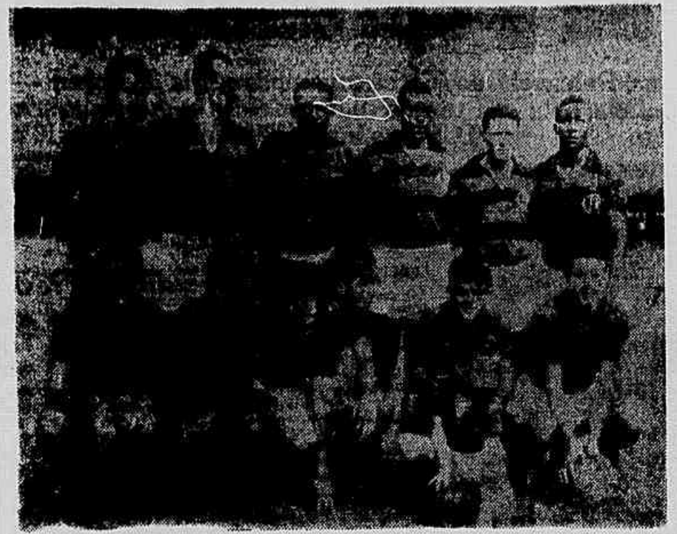
O Flamengo como empatou com o Botafogo. Só por necessidade extrema, Solich modificaria o quadro.

Os rubros-negros, que esperam manter a liderança, iniciarão a concentração na Casa Grande da Estrada de Gávea, na próxima sexta-feira.