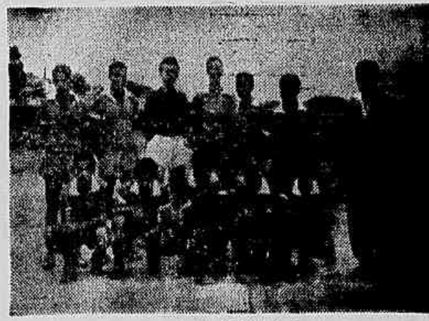
O As de Ouro, popular agremiação do subúrbio de Inhamitã não atravessa bem fase, pois vem há vários jogos e treinos revessos que têm deixado seus admiradores apreensivos. Espiram os mesmos que o 'Departamento Técnico' tome as devidas providências.