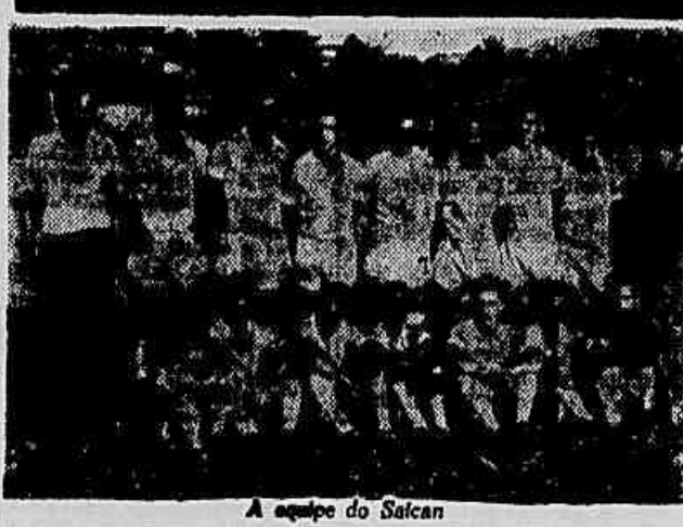
A equipe do Salcan