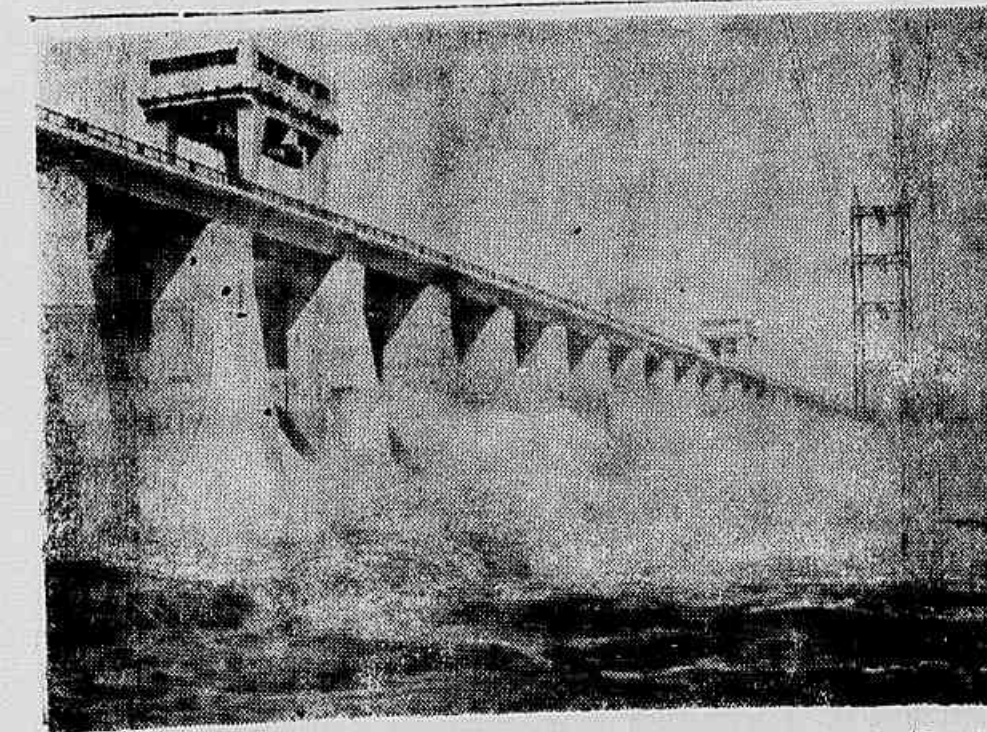
A Maior Hidrelétrica do Mundo — Entre as realizações comemorativas do 40.º aniversário da Revolução de Outubro na União Soviética, figura a inauguração da central hidroelétrica de Kuibichev, no Rio Volga. Com uma potência de 2 milhões e 100 mil quilowatts, essa geradora é a maior do mundo, e fornecerá à URSS colossal massa de energia elétrica.