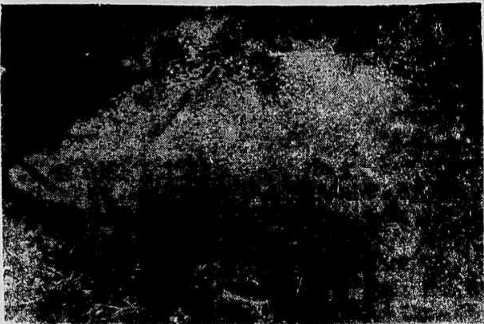
O pontão que se vê acima foi fotografado ontem, na Pavuna, em zona residencial. Por baixo da água stagnante, no fundo do poço, acha-se o registro do serviço de águas. É assim que o tifo se propaga

JÁ CONSTATADOS 466 CASOS DE DOENTES E 11 ÓBITOS — NOVAS VÍTIMAS FORAM REGISTRADAS EM COPACABANA — O MINISTÉRIO DA SAÚDE PROMETE INTERVIR, SE O ATUAL SURTO SE AGRAVAR — MOBILIZADOS OS HOSPITAIS DA PREFEITURA — RECOMENDAÇÃO DAS AUTORIDADES À POPULAÇÃO: SÓ BEBER ÁGUA DEPOIS DE FERVIDA E VACINAR-SE EM MASSA