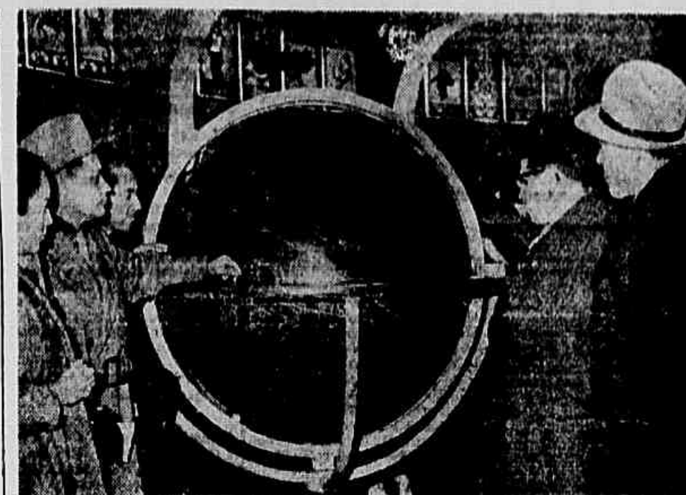
O LANÇAMENTO DOS "SPUTNIKS" — Contas de pessoas dirigem-se, diariamente, ao "Planctarium de Moscou", demonstrando grande interesse sobre os detalhes do lançamento e do vôo dos satélites artificiais. Recentemente, uma delegação de sindicalistas de vários países visitou aquela organização científica, tendo ocasião de presenciar, como mostra o clichê, uma exibição sobre o lançamento dos "Sputniks".

Sob o regime socialista, a Tchecoslováquia desenvolveu expressivos desenvolvimentos industriais. Um exemplo disto se pode ver na cidade de Ostrava, o coração da indústria tcheca. Aqui, há duas grandes usinas siderúrgicas.