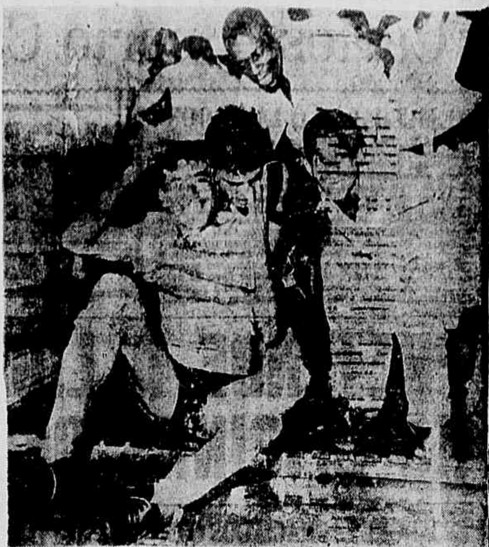
De uniforme e tudo, Santos sentou-se em banco do clube e, depois, saiu a pé. Nem assim, porém, arrefeceu o calor do craque que, entusiasmado, gritava: "que vitória espetacular". Que resultado maravilhoso!

O jogo ao Dinamo, de Moscou, nesta Capital, está ameaçado de não mais se realizar, em virtude da ausência de 4 elementos do quadro principal. Todavia, pedimos a quem se preocupa com o jogo, que não se deixe levar pela segunda parte da malandragem, e que se poderá dizer se haverá ou não aquele jogo. Também a data da partida, se houver, será decidida com a chegada do restante da delegação.