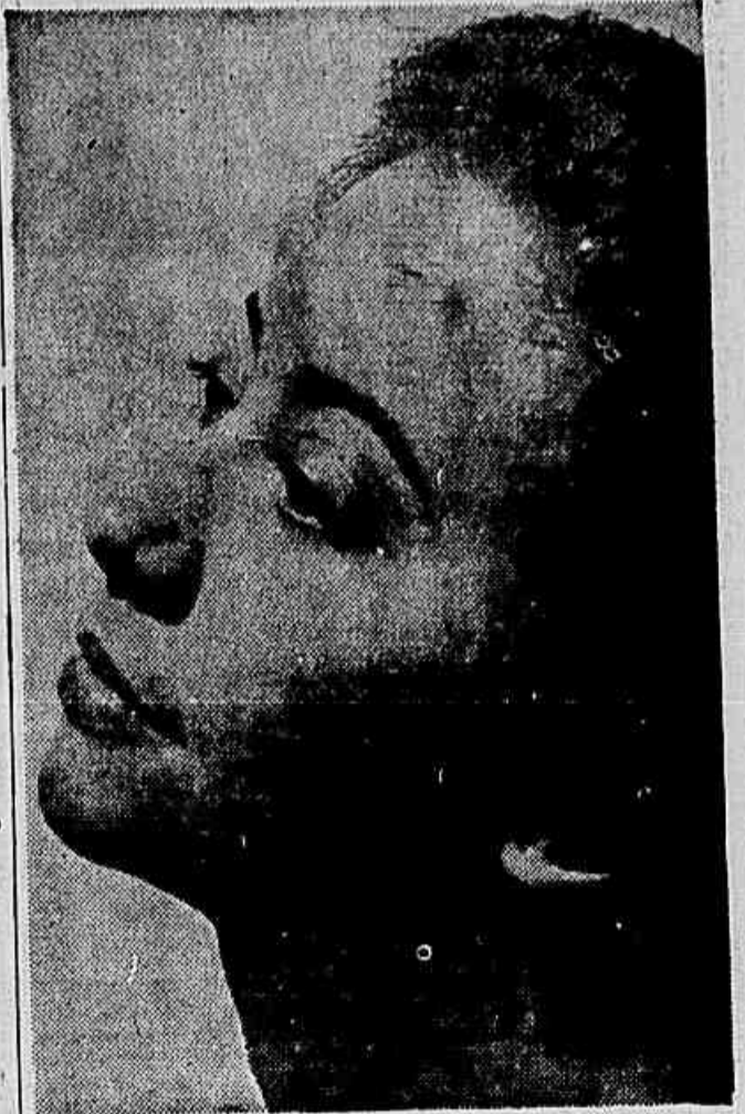
FERNANDA MONTENEGRO, uma vez mais consagrada