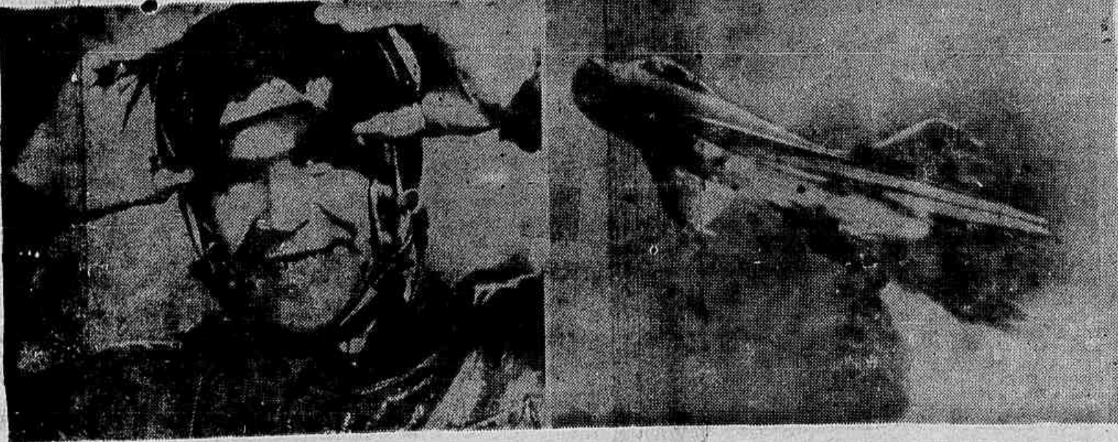
Avião Soviético Lançado de Catapulta — Engenheiros e desenhistas soviéticos inventaram um sistema para o lançamento de aviões de caça, mediante catapulta, que torna dispensáveis os aeródromos. A catapulta é instalada sobre uma plataforma móvel que pode ser levada não importa para que lugar: campo, floresta, montanhas ou desertado. A invenção aumenta consideravelmente a capacidade de combate dos aviões. Na foto da esquerda aparece o tenente-coronel V. G. Ivanov, herói da União Soviética, que voou, com êxito, num avião catapultado (à direita).