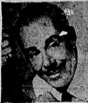
"Serenata", Long-Play de Silvio Caldas. Foi o micro mais vendido em 1957 do selo Columbia.

No "Programa César de Alencar", que a Rádio Nacional apresenta aos sábados, a partir das 15 horas, diretamente do auditório, foram lançadas três novas produções de Hildo do Soveral: "Rádio-revista Leve" ..... (15,30), "Carnaval começa na fábrica" (16,35) e "A ordem do Rei" (17 horas). Em substituição a "Plagantes da Música Brasileira", a Nacional lançou outra produção de Paulo Tapajós: "Noa-na música", que vai ao ar às 20,35 horas das terças-feiras.