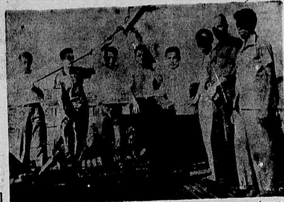
A tripulação de um dos barcos-pesqueiros da Fundação Abrigo Cristo Redentor, cujos esforços tem sido dificultados pela ausência de um entreposto de pesca adequado

— Não. Não se trata de vender os barcos nem acabar com a atividade de pesca da Fundação. A pesca é rentável mesmo. É uma indústria nascente no Brasil e passa por inúmeras dificuldades. No ano findo, de fato, tivemos prejuízo de 40 a 500 mil cruzeiros; mas no ano de 1956 tivemos um lucro de 2 milhões de cruzeiros. Temos fé de que superaremos estas dificuldades. Mas para isto é-nos indispensável o apoio do governo. Até então a Fundação tem contado com a ajuda do governo em várias iniciativas. Porém, agora, o governo tem que ajudar não só a Fundação no caso da pesca, e sim a toda a indústria pesqueira assim como faz com a agricultura e outros setores econômicos. Aproveitamos a oportunidade para fazer um apelo, através do seu jornal, para que a União nos dê abastecimento na compra de combustíveis.