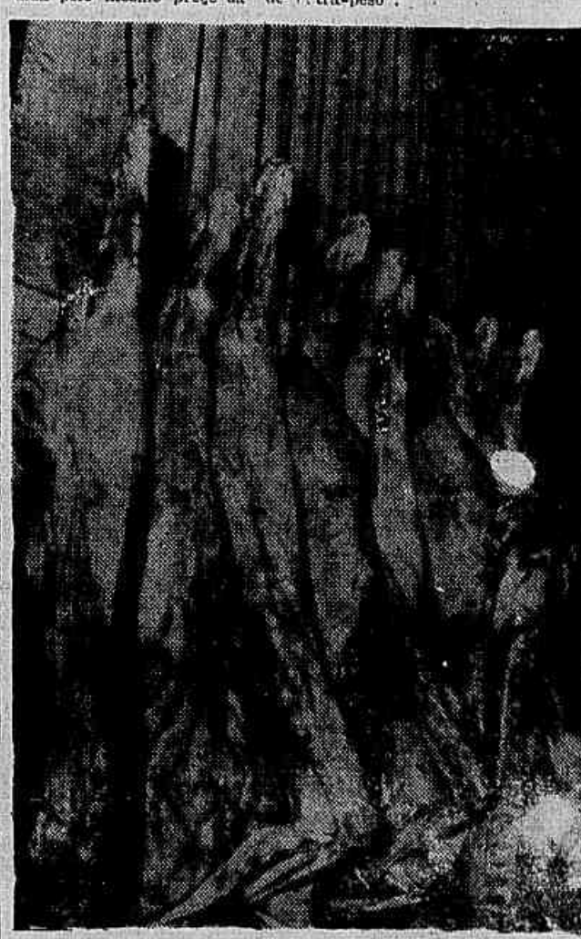
A liberação do preço da carne, apesar de ser época da safra, está conduzindo à majoração dos preços do produto