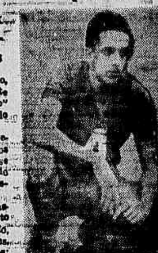
Na foto e impetuoso pelo Rubens, comandante do ataque do Raio-X, que balançou a rede de gol por cinco vezes consecutivas

ABRINDO A 2ª RODADA Passando para a terceira rodada, a representação do Serviço do Pessoal e do Arquivo Médico travará um jogo que tem na qualidade de heróis a sua atuação. Ambos os quadros estão em plena forma física e técnica, devendo proporcionar ao público que comparecer ao campo do Operário um espetáculo.