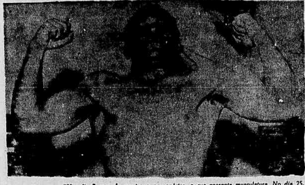
No clichê, vemos "Virgulino", quando mostrava ao repórter, a sua possante musculatura. No dia 25, então, teremos a oportunidade de vê-lo em ação, lutando contra "Braço de Ferro".

Aguardam-se grandes arrebatações de gols nos jogos do Fluminense, já que o interesse da torcida é bem maior do que quando lá esteve, recentemente, o São Paulo, que também saiu invicto do Pará.