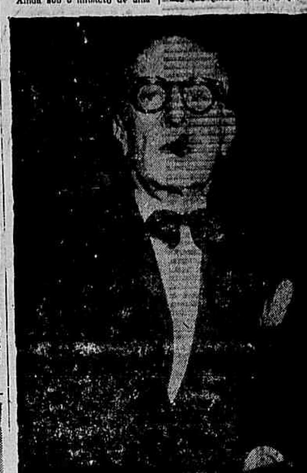
«O Brasil tem um grande futuro, mas é preciso não envenenar o ambiente», declara o general Flores da Cunha.

mas é preciso não envenenar o ambiente. Brasil, apesar das dificuldades que enfrentamos, daqui a