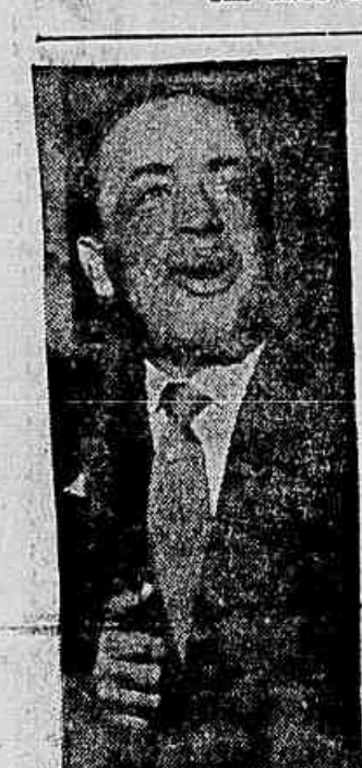
Governador Antônio Balbino.

Pleiteada a majoração de 1,60 por litro — Seriam atingidos 60 por cento dos consumidores — Quer a CCPL mais 21 milhões de cruzeiros para cobrir um déficit que não provou — Dividida a COFAP em face do pedido, cujo julgamento foi adiado