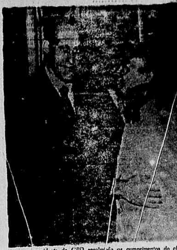
O novo presidente da CBD recebeu os cumprimentos do chefe da seção esportiva da IMPRENSA POPULAR. Em sua entrevista a este jornal, Havelange disse que visitará todas as federações de Norte ao Sul do país.

Depois, João Havelange se referiu ao funcionamento interno da CBD, declarando: «Conceito muito bom todos aqueles que trabalham na CBD. São funcionários de