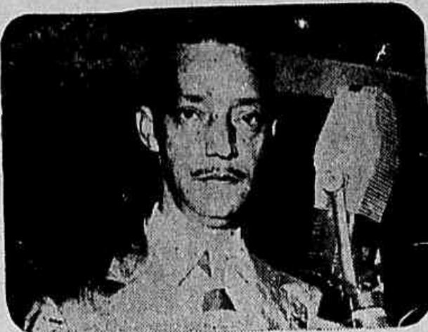
Orlando Silva, «o cantor das multidões», estará hoje, às 12 horas, em mais uma audição.