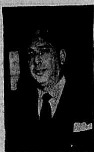
Prefeito Negrão de Lima

PRORROGAÇÃO Sobre a prorrogação de mandatos manifestou-se o