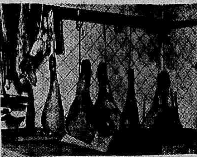
O cel. Mindelo disse que a carne ia baixar, depois da liberação, para Cr$ 49,00... Agora, depois da liberação, apenas duas semanas, custa de Cr$ 44,00 a Cr$ 48,00 o quilo

DIZEM OS FAVELADOS QUE PERDERAM SEUS BARRACOS: