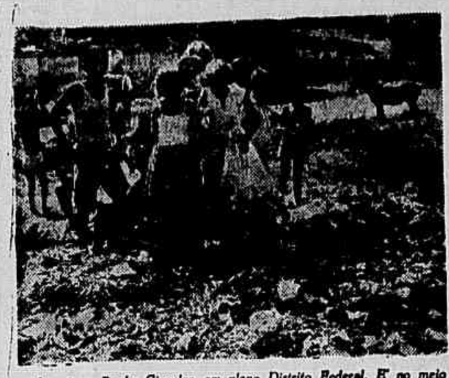
Ita é na Penha Circular, em pleno Distrito Federal. E' no meio do lixo que esses pequenos brincam. Por que? Não há quintal em suas casas e não houve a preocupação de equipar um Parque Infantil para as crianças daquela zona.

Adiante um burrinho amarrado põe em perigo a integridade física dos garais, ameaçados de serem mordidos ou levarem coice.