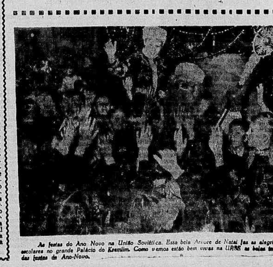
As festas do Ano Novo na União Soviética. Essa bela Anjura de Natal faz as alegrias dos escolares no grande Palácio do Kremlin. Como vemos estão bem vivas na URSS as belas tradições das festas do Ano-Novo.

Falamos sobre o Sentimento de responsabilidade como um dos fatores essenciais na educação. Livremos agora algumas palavras sobre algo que consideramos também sumamente importante nas boas relações humanas: o sentimento de respeito mútuo. É preciso que a criança sinta desde muito pequena que o respeito que dela exigimos para conosco lhe é retribuído de idêntica maneira. Não sei como se passam os fatos em muitos países, mas em alguns deles tenho notícia de que a criança é tratada com um respeito totalmente desconhecido entre nós. Isto sem nos referirmos ao menor que trabalha. Em casa, na escola, por parte de pais e de professores o menor geralmente tratado de maneira desrespeitosa e mesmo humilhante. Dizem-se coisas, insinuam-se fatos, atribuem-se atitudes à criança diante dela ou em sua ausência, que jamais alguém teria a coragem ou levandade de o fazer a um adulto. No caso da mentira, por exemplo. Todos nós que lidamos com crianças e observamos suas relações com adultos, somos testemunhas da verdadeira e criminoso levandade com que um adulto desmente uma criança, ou declara abertamente: é mentira, esse menino vive mentindo, deixe-se de mentiras etc.