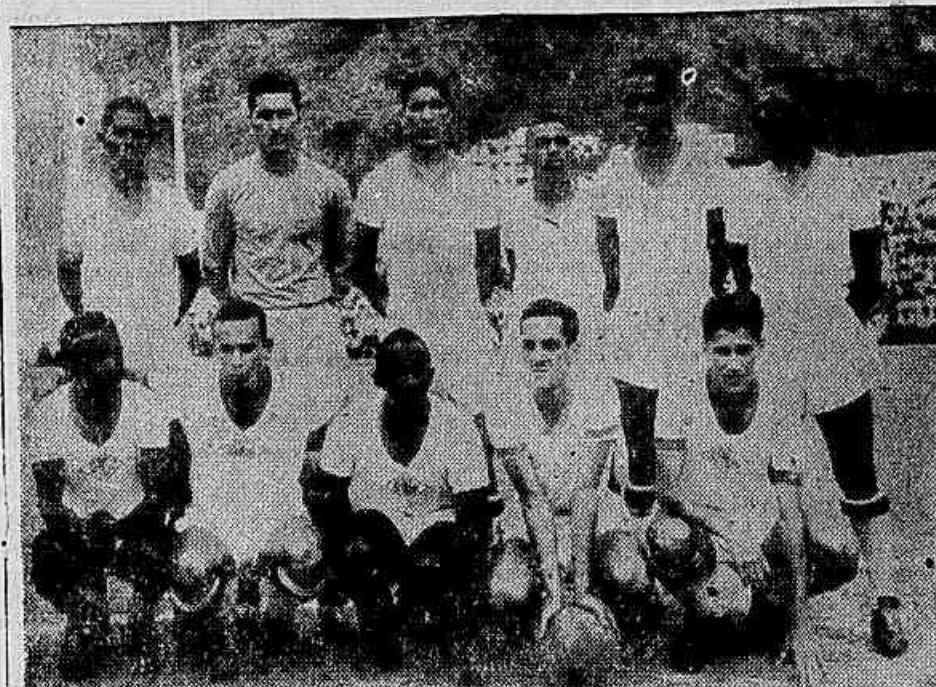
A equipe do Bangu que, com algumas modificações, jogará esta tarde em Guaratinguetá

Esperam os organizadores das duas chapas levar a urna o maior número de votos possíveis, fazendo com que a eleição venha marcar um recorde de comparecimento.