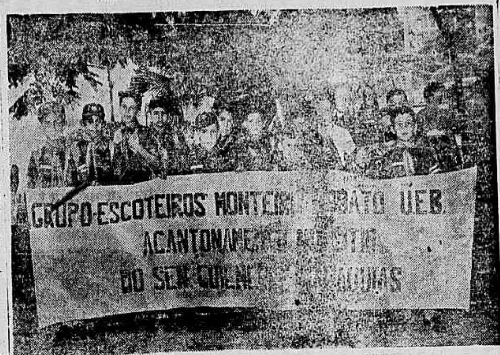
O acantonamento dos «lobinhos» do 21.º Grupo de Escoteiros Monteiro Lobato, atendendo ao convite feito pelo senador Guilherme Malagutas, visitou o sítio daquela parlamentar, na Estrada Rio-Petrópolis no domingo passado. Na ocasião, foi oferecida ao senador Guilherme Malagutas uma fumaça da corporação. Passeio bem animado, do qual se vê o flagrante acima.