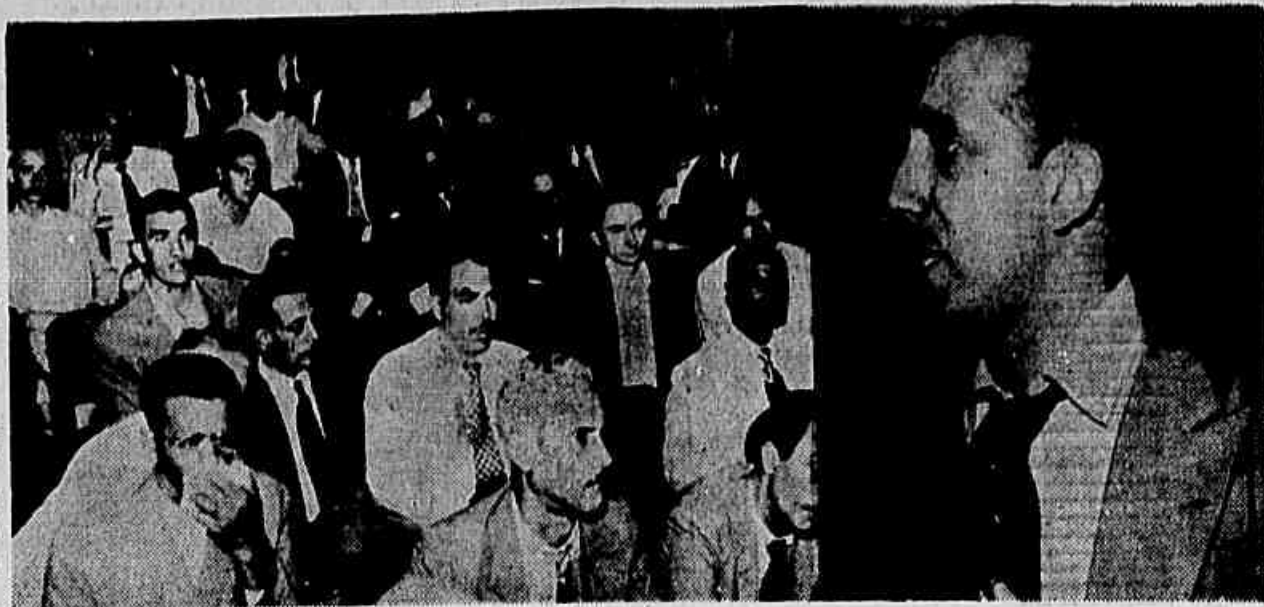
Foi bastante concorrida a reunião inter-sindical de ontem, no Sindicato dos Aeroviários, de que damos os flagrantes acima: parte da assistência e o deputado José Gomes Talarico usando da palavra

1) Seja enviada uma comissão de marítimos à Assembleia dos Aeroviários a fim de esclarecer os pontos firmados (CONCLUI NA 2ª PAG.)