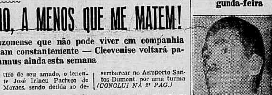
Governador Muniz Falcão

Regressa Hoje Muniz Falcão Reassumirá o governo na próxima segunda-feira