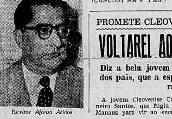
Escritor Afonso Arinos

O sr. Afonso Arinos de Melo Franco foi eleito ontem pela Academia Brasileira de Letras (CONCLUI NA 2ª PAG.)