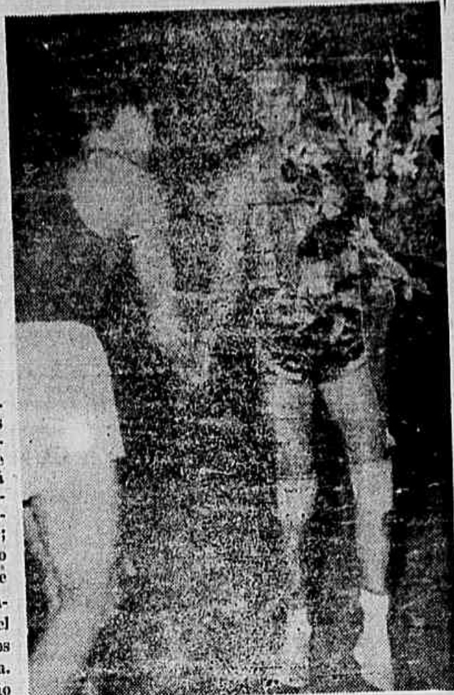
Algodão, o grande jogador brasileiro, recebendo uma cesta de flores num dos encontros internacionais de que participou

SANTIAGO, 23 (FP) — A maioria das delegações que participam do campeonato sul-americano de basquetebol, que se iniciará amanhã, já está em Santiago. Os argentinos estão hospedados no Hotel Claridge; peruanos e uruguaios no Hotel Albiou; brasileiros e paraguaios, no Hotel Espana; equatorianos no Hotel Windsor; e os colombianos no Internato Barros Arana. Ontem realizou-se a sessão preparatória do Congresso sul-americano.