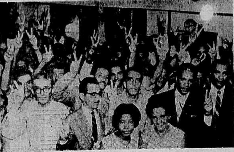
A numerosa comissão de trabalhadores da Prefeitura de Nova Iguaçu, tendo à frente a diretoria da UNSP, quando visitava nossa redação, logo após tomarem conhecimento da sentença do Juiz da 7.ª Junta de Conciliação e Julgamento