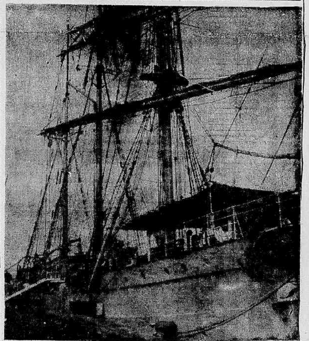
A fragata «Mercator», no «pier» da Praça Mauá

Em comemoração ao 150º aniversário da abertura dos portos, realizará-se hoje, às 20 horas, no salão nobre da Associação Comercial de Niterói, 286, uma conferência sobre o tema: «O nacionalismo na política externa do Brasil». O ato será patrocinado pela União Estadual dos Estudantes Secundários e serão conferencistas o senador Domingos Velasco e o deputado Jonas Bahlense. Foram convidados o governador e o vice-governador do Estado, deputados, senadores, líderes religiosos, sindicatos operários e diversas entidades.