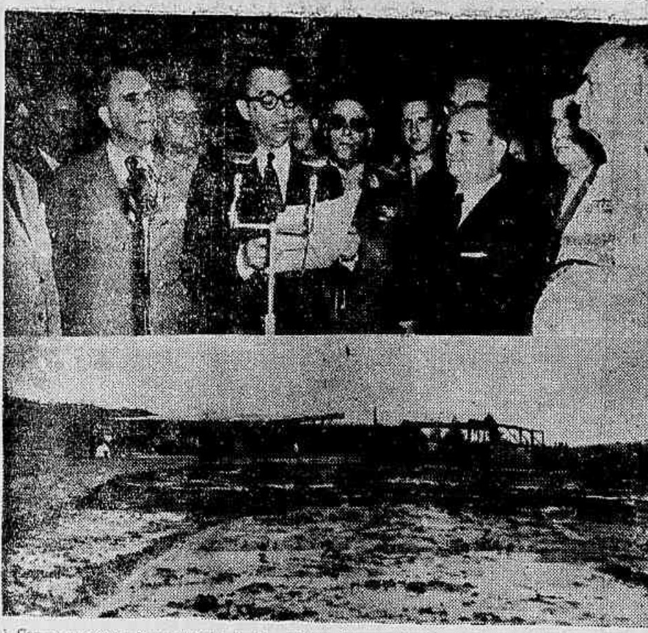
Com a presença do presidente da República e outras autoridades, realizou-se a cerimônia do lançamento da pedra fundamental da Refinaria do Rio de Janeiro. Na fotografia acima, o sr. Juscelino Kubitschek, discursando durante a solenidade. Embaixo, o local em que será construída a refinaria, no Quilômetro 10 da Estrada Rio-Petrópolis (Ver noticiário na 3ª página).