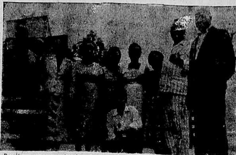
De pijama, em casa, ontem à tarde, Pixinguinha, entre familiares e amigos, riu do susto que raspiou na madrugada anterior...

Tempo nublado Temperatura estável Máxima 29,7 na Penha Mínima 20,4 nas Laranjeiras.