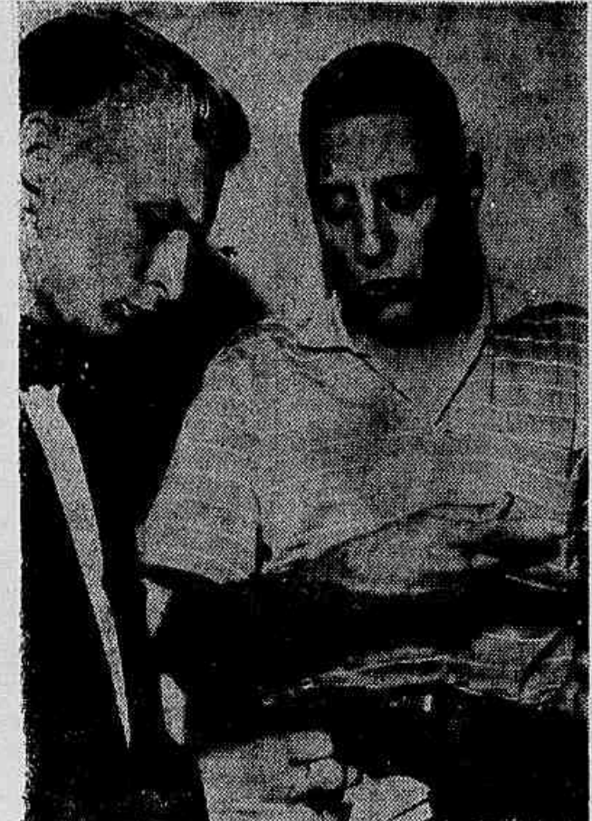
— Cada «Vanguard» que explode, mais sobe o nosso «Sputneka» — afirma Max Nunes ao cronista

Reportagem de Maurício de Almeida