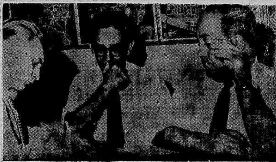
Senador Carlos Cavalcanti e Senador Alencar, quando falavam à reportagem

O ato da SUMOC foi consequência de pressão direta da Embaixada Americana sobre o governo — Interessada a Standard Oil — Mobilizam-se os industriais paulistas para anular a impatriótica decisão (Leia na 3a. Página)