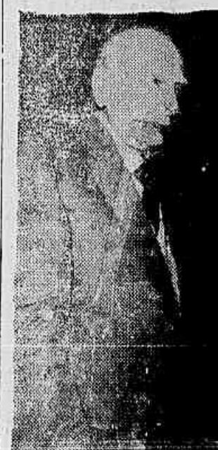
Passou mais de meio século na Tribuna do Juri

ROMA, 15 (FP) — Ingrid Bergman chegou a Roma, onde pretende permanecer por cerca de três semanas. Interrogada pelos jornalistas, a atriz declarou que não tinha, no momento, nenhum projeto de trabalho, pretendendo apenas descansar junto a seus filhos.