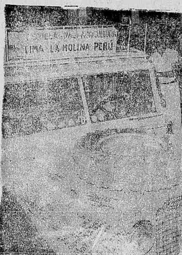
O jipe dos estudantes peruanos, que vai desfilar no carnaval carioca

CHUVAS: PERSPECTIVAS SÃO POUCAS A boa notícia para o folião foi a última prestada pelo Cel. Maldonado, sobre a possibilidade de uma chuvurada, pois, segundo ele, o aquecimento não molhará o Rio n.º das de «fofoca». Portanto, poderá o carioca «rebelar» bastante sem ser perturbado pelas chuvas.