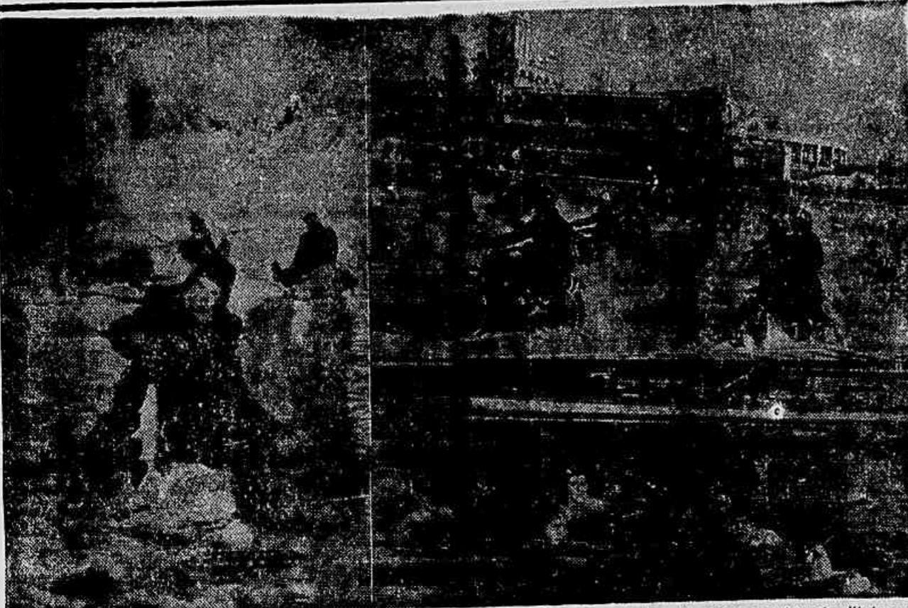
O INVERNO NA UNIÃO SOVIÉTICA — Sobre as águas geladas do rio Amur, engenheiros, técnicos e operários de Khabarovsk abrem buracos sobre a superfície gelada para pescar, indiferentes ao tempo e ao vento frio do norte, segundo vemos na fotografia à esquerda. Ao alto, à direita, nas águas do porto fluvial de Moscou, que também apresentam uma consistente camada de gelo, realiza-se tradicionalmente a corrida de motocicletas em homenagem ao marechal Voroshilov. Finalmente, em baixo, afilhados da natação em águas geladas fazem tranquilamente seus exercícios sob uma temperatura de oito graus abaixo de zero, no rio Moscou.