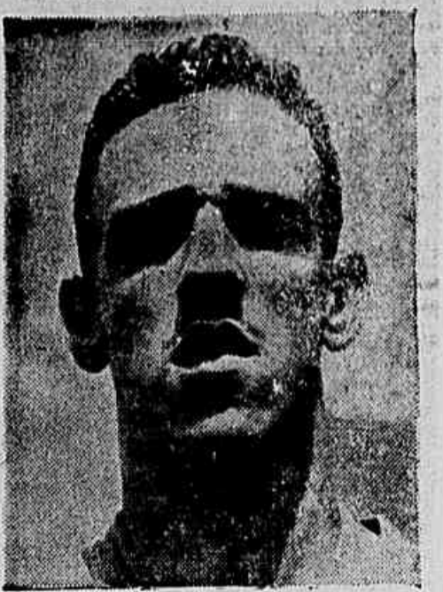
O ponteiro americano, Canário, estará presente ao encontro matinal de hoje

Eucledes Pires da Silva será o árbitro deste jogo e o preço das ingressas será de Cr$ 25,00 para todas as localidades.