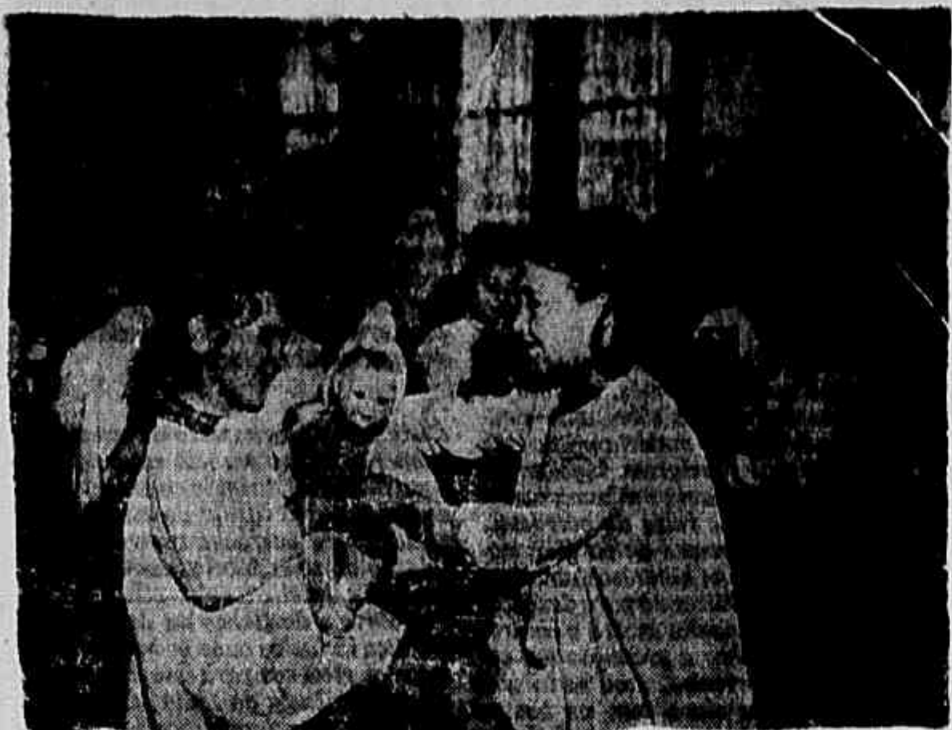
Enquanto as mães trabalham sem preocupações, seus filhos crescem cercados de todo cuidado e carinho nas creches e jardins de infância, cujo número triplicou durante o segundo quinquênio

A 24 de fevereiro de 1891 foi promulgada a primeira Constituição republicana. A 25 de fevereiro de 1888 era fundado o Instituto Pasteur, por iniciativa da Santa Casa da Misericórdia. A 19 de fevereiro de 1649 travou-se a segunda batalha de Guararapes. E que essa batalha foi assim denominada por ter sido deflagrada no monte do mesmo nome. A 21 de fevereiro de 1945 os soldados brasileiros em viandas nos campos da Itália, comandados pelo general Mascarenhas de Moraes, saltaram e tomaram o reduto nazi-fascista do Monte Castelo.