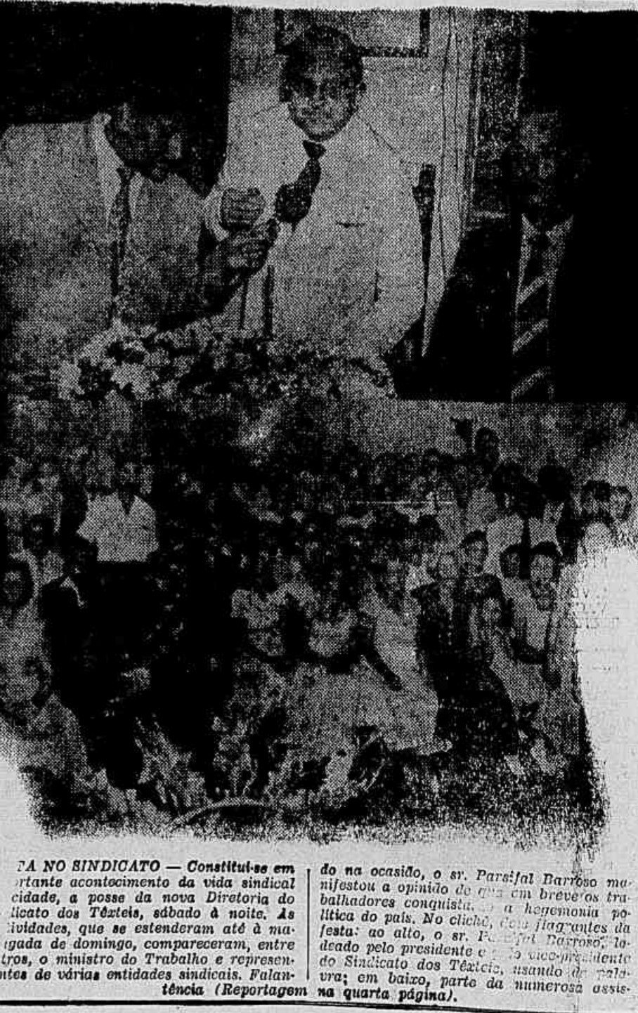
TA NO SINDICATO — Constituiu-se em instante acontecimento da vida sindical, a posse da nova Diretoria do Sindicato dos Têxteis, sábado à noite. As atividades, que se estenderam até a madrugada de domingo, compareceram, entre outros, o ministro do Trabalho e representantes de várias entidades sindicais. Falanstência (Reportagem na quarta página).

São Paulo, 24 (Agência Nacional) — O Instituto do Açúcar e do Alcool acaba de reconhecer o Estado de S. Paulo como o maior produtor de açúcar do Brasil, elevando para 14 milhões e 800 mil sacas a quota atribuída ao Estado. Até agora, Pernambuco era apontado como o maior produtor, com uma quota de 12 milhões e 400 mil sacas. Quanto ao álcool, a produção de São Paulo também deverá aumentar proporcionalmente, segundo prognóstico do IAA, as usinas que se acham em atividade no interior do Estado deverão produzir 230 milhões de litros, aproximadamente.