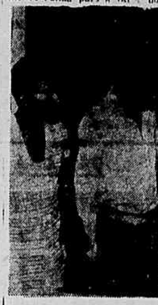
Na foto: a comissão de adventícios, quando falou a nossa reportagem

de dezembro do ano passado foi encaminhado ao Sindicato um relatório com uma série de perguntas que deveriam ser respondidas. Como a diretoria daquela entidade nada respondeu, houve um encontro do presidente do Sindicato com o chefe do gabinete do ministro do Trabalho quando ficou decidida a normalização de uma mesa-redonda para a tarde do