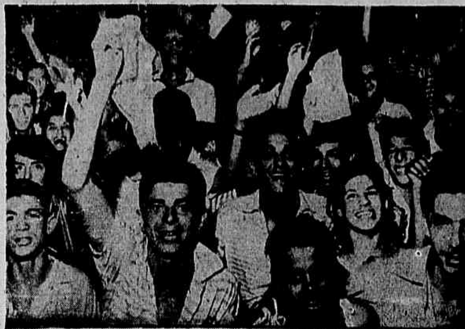
Durante o período carnavalesco o GREIP (Penha) realizou o grandioso baile que se constituiu em novas vitórias para a simpática agremiação Leopoldinense. No flangente acima um aspecto da folia na terça-feira passada

CONTRIBUÍDORES DE AMBÍTO REGIONAL A contribuição de âmbito regional será a mais alta valia para os trabalhos concluídos de julho, sendo o Brasil nação de área. AJUDE A IMPRENSA POPULAR