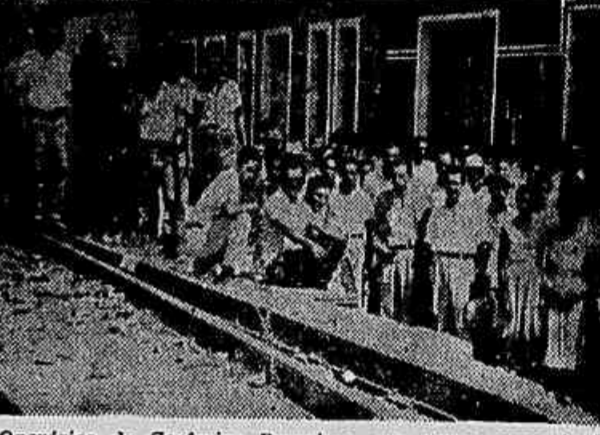
Operários da Cerâmica Barreiros, em greve, concentrados em frente daquele estabelecimento

fizem o mesmo. Manifestando a disposição de somente voltarem ao trabalho, após receberem seus salários, com o acréscimo dos 15%, inclusive, os atrasados, os operários prosseguem coesos, recebendo solidariedade dos demais Sindicatos, do comércio e de próceres políticos de Volta Redonda e Barra Mansa.