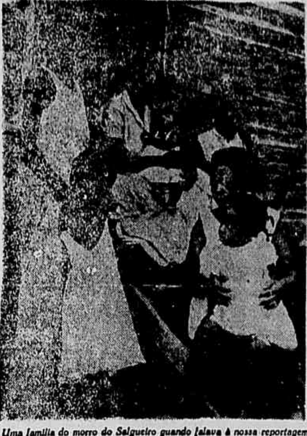
Uma família do morro do Salgueiro quando lavava a roupa na rua