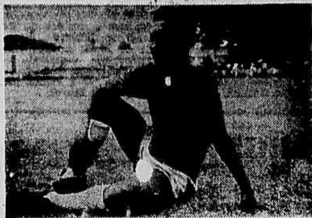
Indio, que a torcida carioca vai rever em ação, hoje, defendendo o Corinthians contra o Botafogo

Pela primeira vez, depois de se apresentar ao público desta cidade, na noite de hoje,