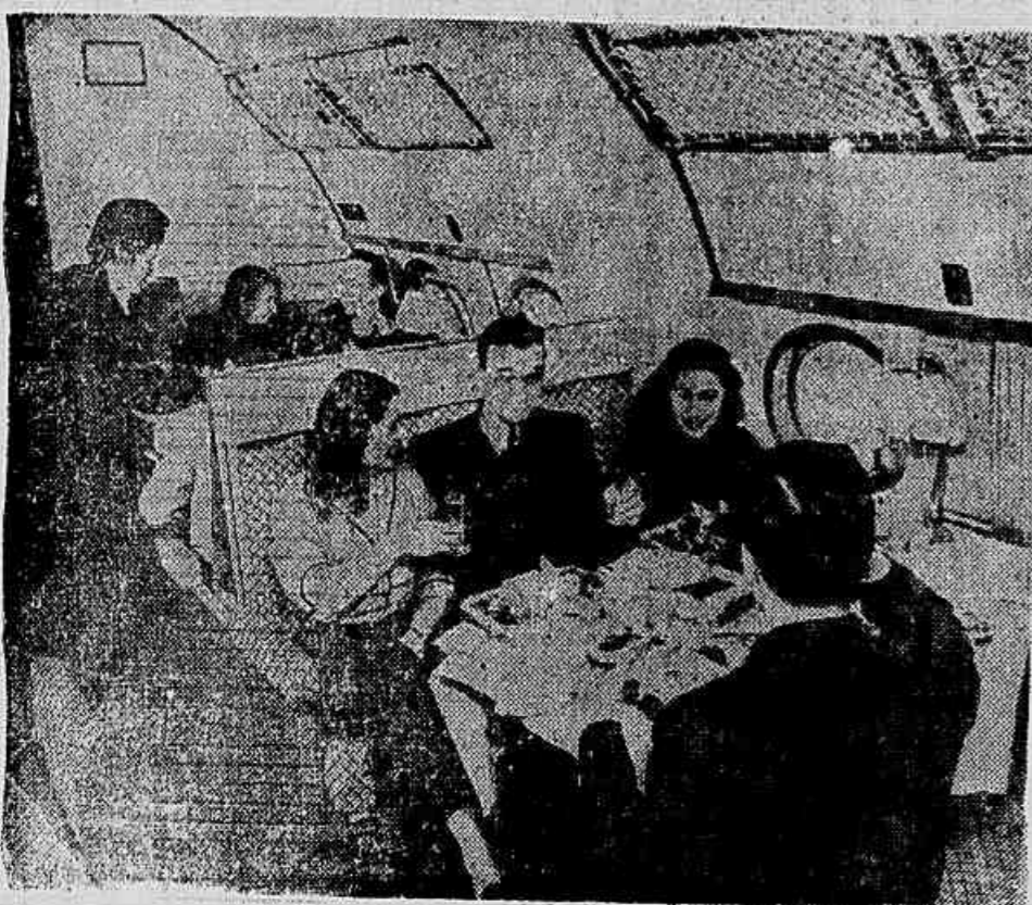
Está sendo esperada, para breve, a incorporação dos aviões "TU-114" à "AEROFLOT", empresa aérea do governo soviético. As gigantescas aeronaves, as maiores e mais eficientes do mundo, equipadas com 4 motores turbo-propulsores e foram construídas para vôos de longas distâncias. Sua construção obedeceu à supervisão do engenheiro A. N. Tupolev, detentor do prêmio Lenin. Atualmente, o "TU-114" está sendo testado sob as mais diferentes condições de voo. No foto, um aspecto do amplo restaurante, vendendo-se passageiros, em pleno vôo, fazendo suas refeições.

Moradores mais exaltados do Núcleo Residencial de Manguinhos, já tentaram bloquear a estrada — Encontra-se à beira da morte uma jovem do conjunto — Crianças, as principais vítimas