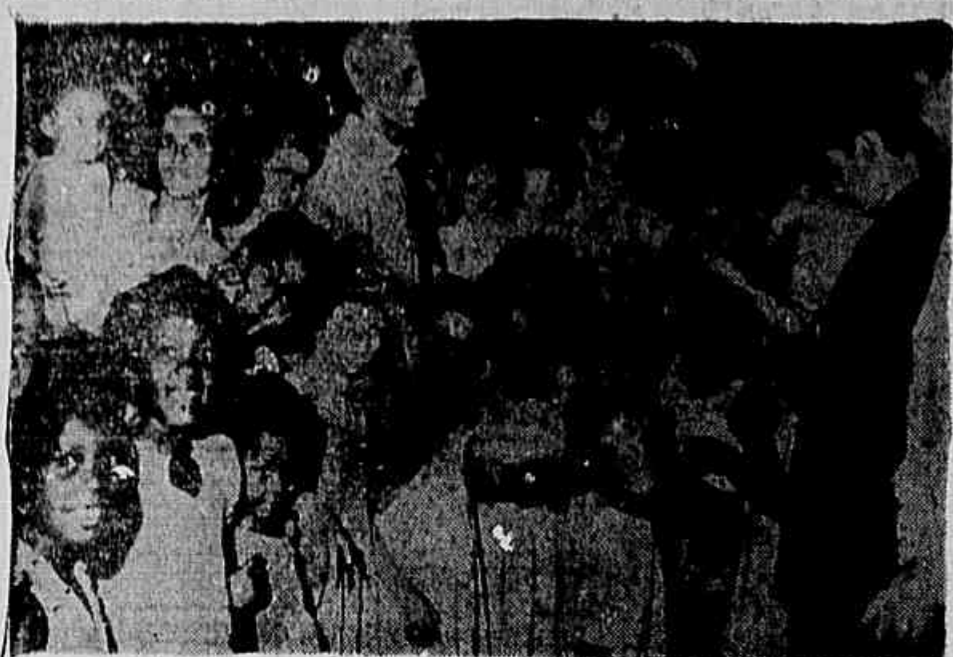
O Presidente da Associação de moradores, cercado por crianças e donas de casa, reclama da Prefeitura a conclusão das obras, com o asfaltamento da estrada. "Do contrário, ela está bloqueada pelos moradores", adverte.

A União Nacional dos Servidores Públicos fará, esta semana, a uma série de reuniões, tendo em vista um amplo esclarecimento dos servidores no que tange a campanha de persuasão a ser iniciada junto a todos os representantes do povo nas duas casas do Congresso Nacional, acerca do Plano de classificação. O ponto culminante da série de reuniões será uma grande assembleia, prevista para o dia 21 do próximo mês, com a participação de representantes dos Estados, quando serão aprovadas emendas ao substitutivo.