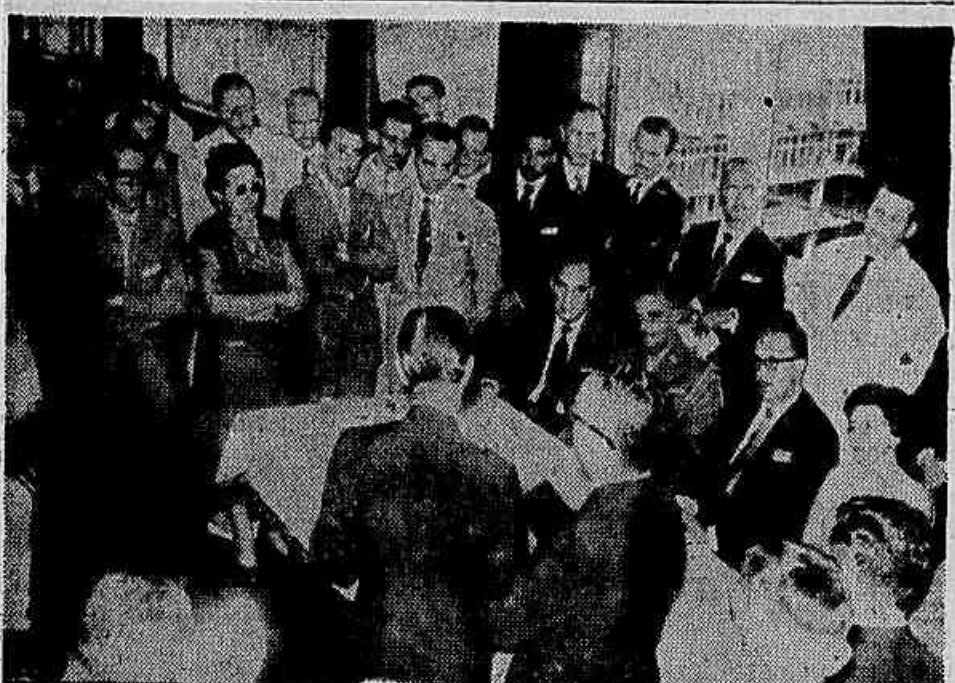
Aspecto da festiva solenidade, que assinalou o segundo aniversário da atual administração do I.A.P.I.

Na queda, o menor sofreu fratura da perna e braço esquerdos. Socorrido por populares, foi encaminhado ao Hospital Miguel Couto, onde se acha internado.