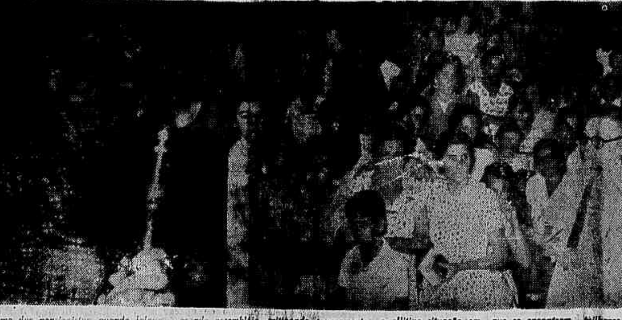
Uma das pensionistas, quando falava na grande assembléia, criticando severamente a alijada situação em que se encontram milhares de dependentes do IPASE