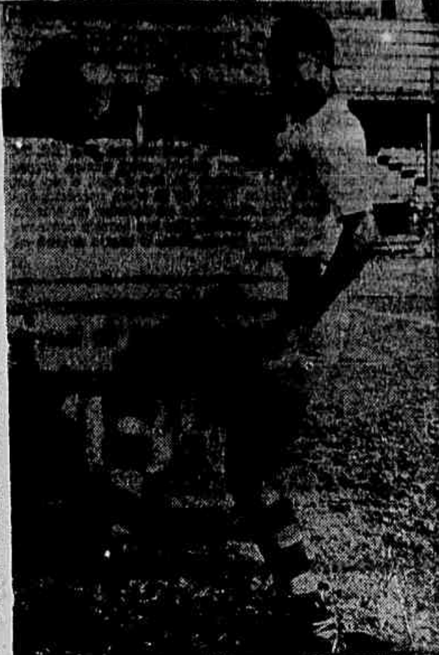
O veloz ponteiro Lusurinha (foto), estará presente no jogo de hoje, contra o Vasco

Será por todos estes motivos, um jogo muito bom, podendo levar ao Pacaembu, uma assistência considerável.