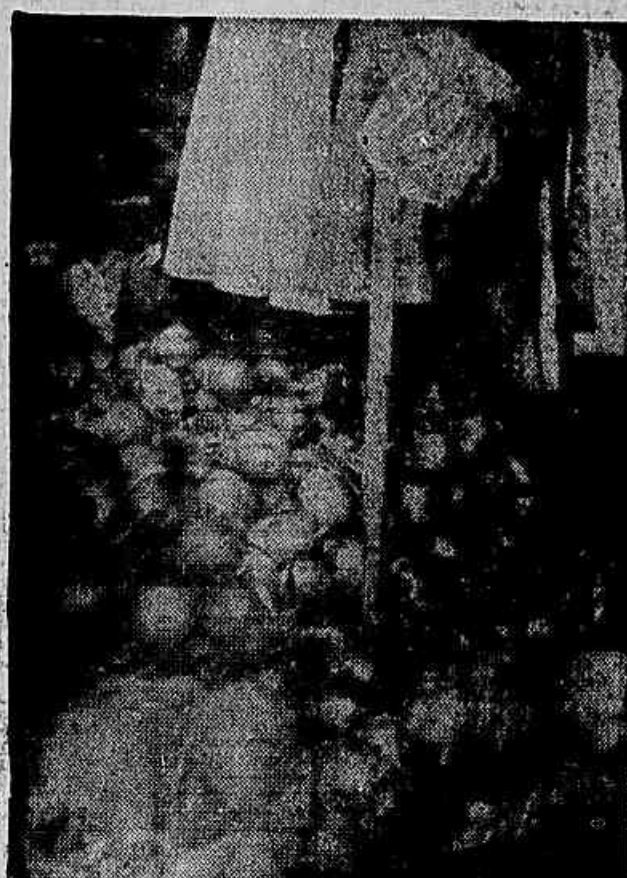
As donas de casa estão alarmadas com o preço atual da cebola. Querem e dois cruzeiros o quilo, produto de qualidade duvidosa