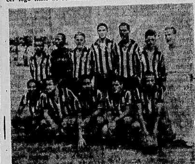
A EQUIPE DO TIROLES

O público que comparecer logo mais ao Maracanã a fim de assistir ao cotejo entre Fluminense x Vasco, pelo