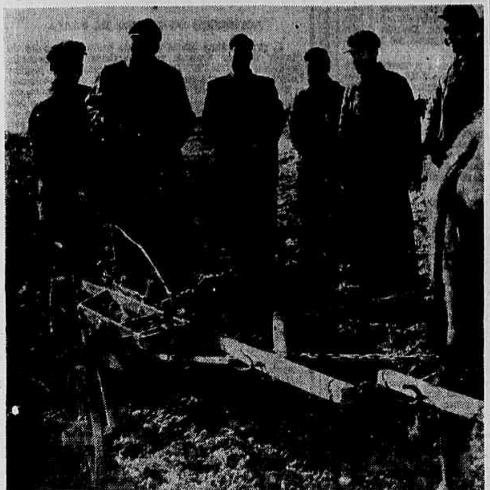
Instituto Agrônomo de Chekiang — Mao Tse-Tung visitou recentemente o Instituto Agrônomo de Chekiang, nos arredores de Hangchow. No clichê, o presidente da China Popular faz perguntas ao camponês Chang Yu-kun (à esquerda) sobre o uso do arado de lâmina dupla

Comenta o «Sovietsky Flot» a reunião da OTASE — Armas americanas lançadas de para-quedas aos rebeldes — Todos os campos petrolíferos nas mãos das tropas governamentais