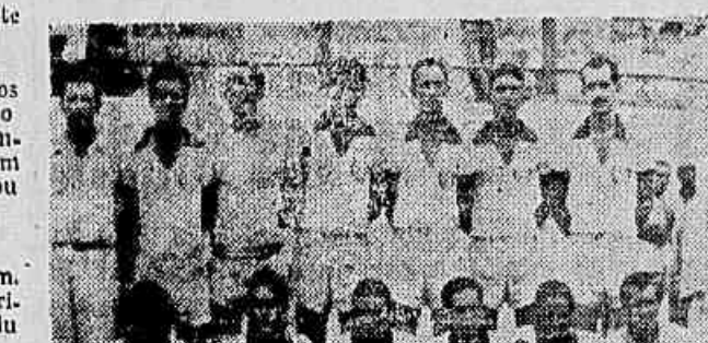
A equipe do Cordovilense, que demonstrou seu valor frente ao Campeão da H.S.E.

O embate encerrou-se sem vencedor, verificando-se um empate de 1 x 1. GENTILEZAS Antecedendo ao encontro principal com as duas equipes reunidas no centro do gramado houve troca de gentilezas com a oferta de flâmulas entre os dois clubes.