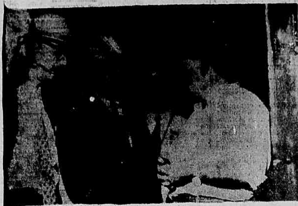
Presidente da República, em companhia do governador de S. Paulo, visita as instalações da Petrobrás em Rio Claro