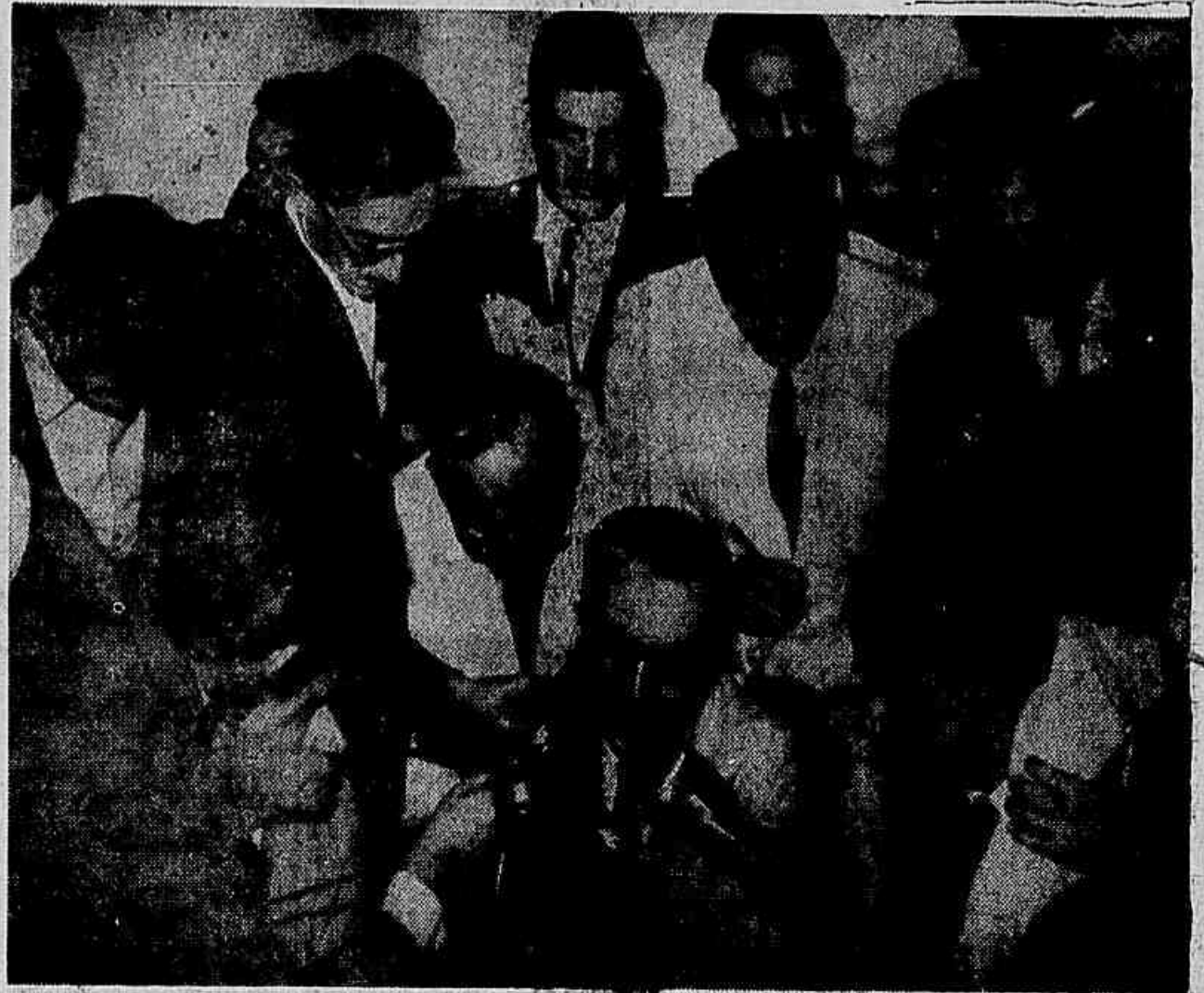
Cerca de cem jornalistas brasileiros e correspondentes estrangeiros aguardavam a entrevista política ontem concedida por Luiz Carlos Prestes, que é visto na foto respondendo a uma das numerosas perguntas.