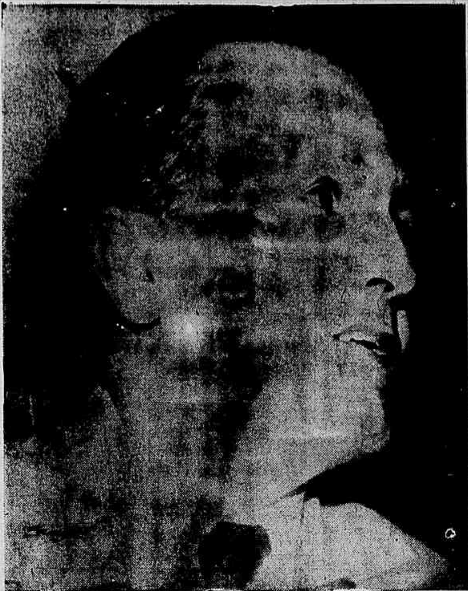
Sorridente e feliz, Luiz Carlos Prestes reapareceu depois de dez anos de clandestinidade.

ANO XI ★ Quinta-feira, 27 de Março de 1958 ★ Nº 2.374