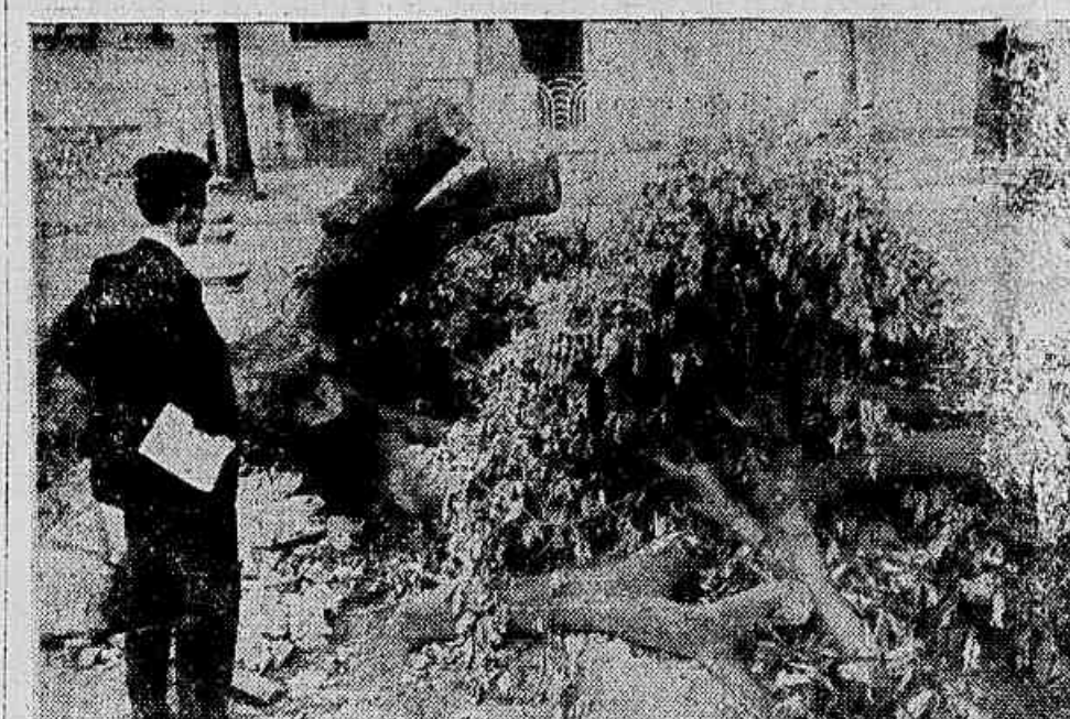
Na Rua Félix da Cruz, uma árvore foi arrematada pelo temporal de ontem e quase impediu a passagem pela calçada. A Prefeitura, no entanto, nada fez além de cortar alguns galhos para tirá-los dali, mas isto não passou de ensaio.

Uma árvore da R. Félix da Cruz, tombada durante o temporal, dado ao seu