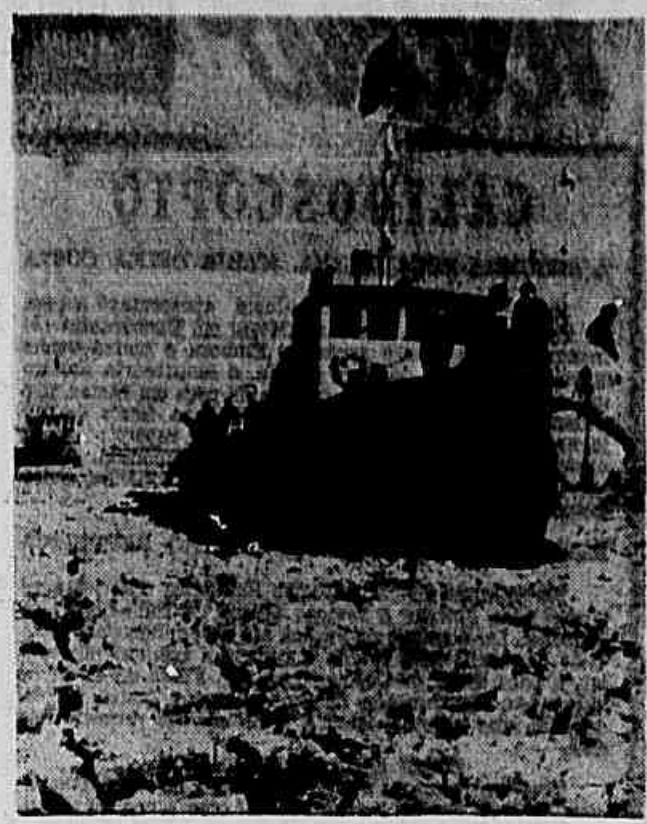
Já estão sinistrando o gelado leito do Rio Amarelo os dois primeiros quebra-gecos construídos nos estaleiros da República Popular da China. Os dois potentes barcos estão equipados com motores diesel de quatrocentos cavalos e podem penetrar e quebrar camadas de gelo de até 20 centímetros de espessura. O gelo com certa frequência, tem recoberto a superfície do Rio Amarelo, na Província de Shantung, fenômeno esse que já se repetiu 35 vezes nos últimos 102 anos. A fotografia da Agência Nova China, especial para IMPRENSA POPULAR, mostra um quebra-gelo em pleno trabalho.

PARSOVIA, 26 (FP) — A descoberta de ser descoberto em Sopot, na região de Zelenka-Gora, nova fossa comum contendo, ao que parece, restos mortais de prisioneiros de guerra alemães. Os restos mortais foram encontrados em uma cova profunda de 10 metros, na qual se encontravam os corpos de 15 prisioneiros alemães. Os restos mortais foram encontrados em uma cova profunda de 10 metros, na qual se encontravam os corpos de 15 prisioneiros alemães.