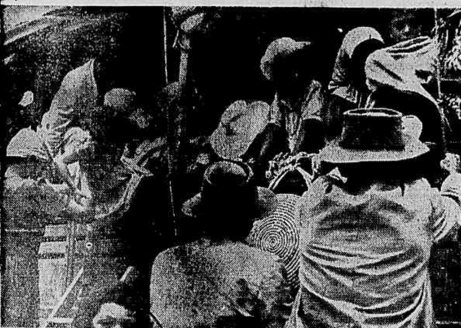
Viajando nos "pau-de-arara" durante dias e dias enfrentando as mais rudes condições, os nordestinos abandonam as regiões flageladas em busca de emprego e trabalho.

BUENOS AIRES, 26 (FP) — Pela segunda vez em 12 dias, o "Comando Tático Peronista" foi alvo de um atentado terrorista. Uma bomba de fraca potência explodiu na noite passada em frente ao edifício onde se encontra a sede do "Comando", sem fazer vítimas e provocando danos insignificantes. O primeiro atentado contra o "Comando" teve lugar no dia 14 do corrente. Depois a organização peronista mudou-se e foi contra a nova sede que se verificou o atentado da noite passada. É o quinto atentado contra a organização peronista desde dia 14. Os atentados são atribuídos a elementos dos "comandos civis revolucionários antiperonistas".