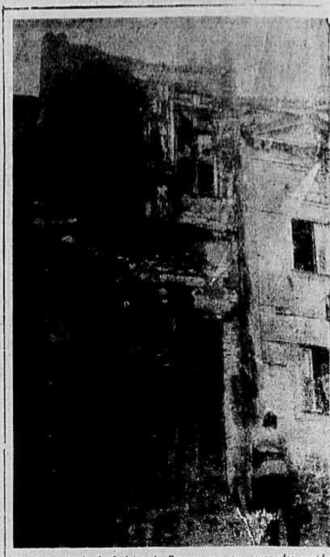
Este é o sobrado da Ladeira do Barroso, que teve uma das paredes destruídas pela chuva.

— Só a nova legislação prevista nos projetos de lei em curso no Congresso Nacional, a lei do Bases e Diretrizes de Educação Nacional e a reforma específica do ensino secundário, que dão maior flexibilidade aos cursos, poderá abrir caminho à solução dos grandes problemas do ensino secundário, que, a meu ver, se resumem nesse conflito entre a estrutura formal e uniforme do sistema e a flexibilidade, a variedade da massa humana que povoa nossas escolas secundárias.