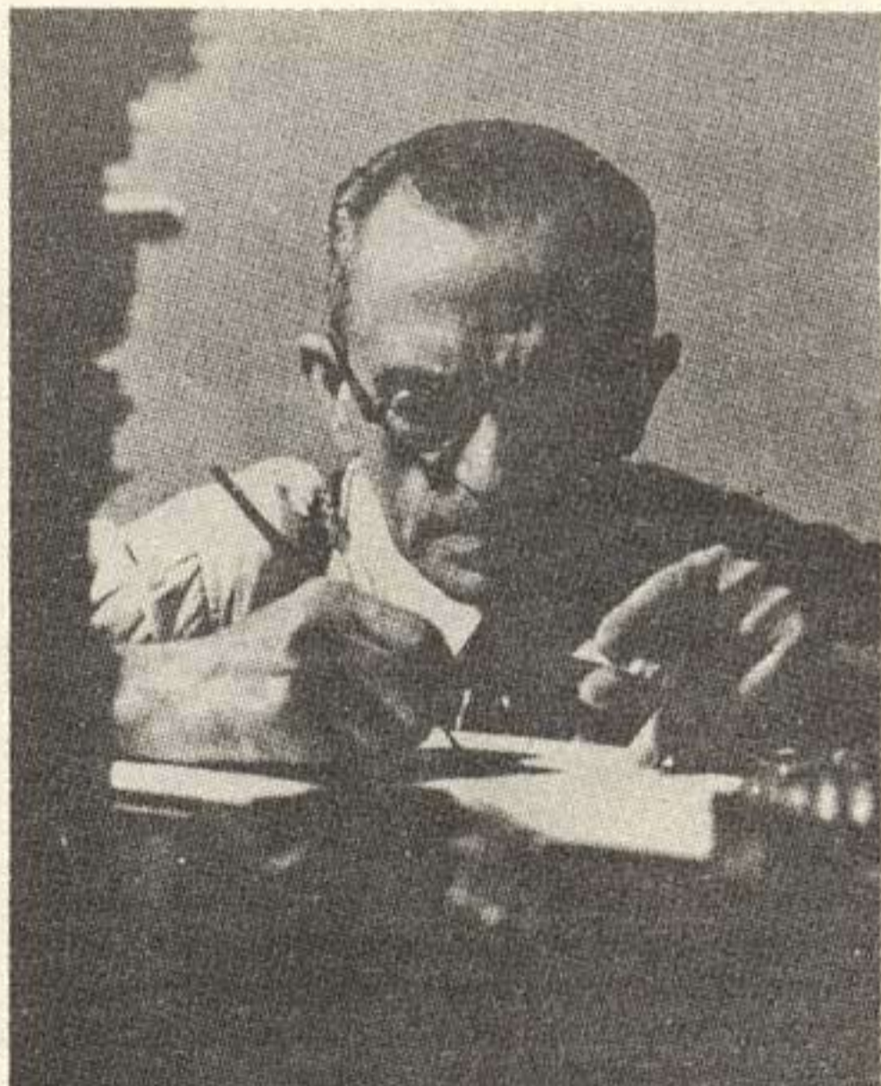
Graciliano - com sua pena e seu cigarro.

Essas especulações de possíveis áreas que se dizem "esquerdistas" ou marxistas querem, no entanto, capitalizar para a sua postura anti-re-