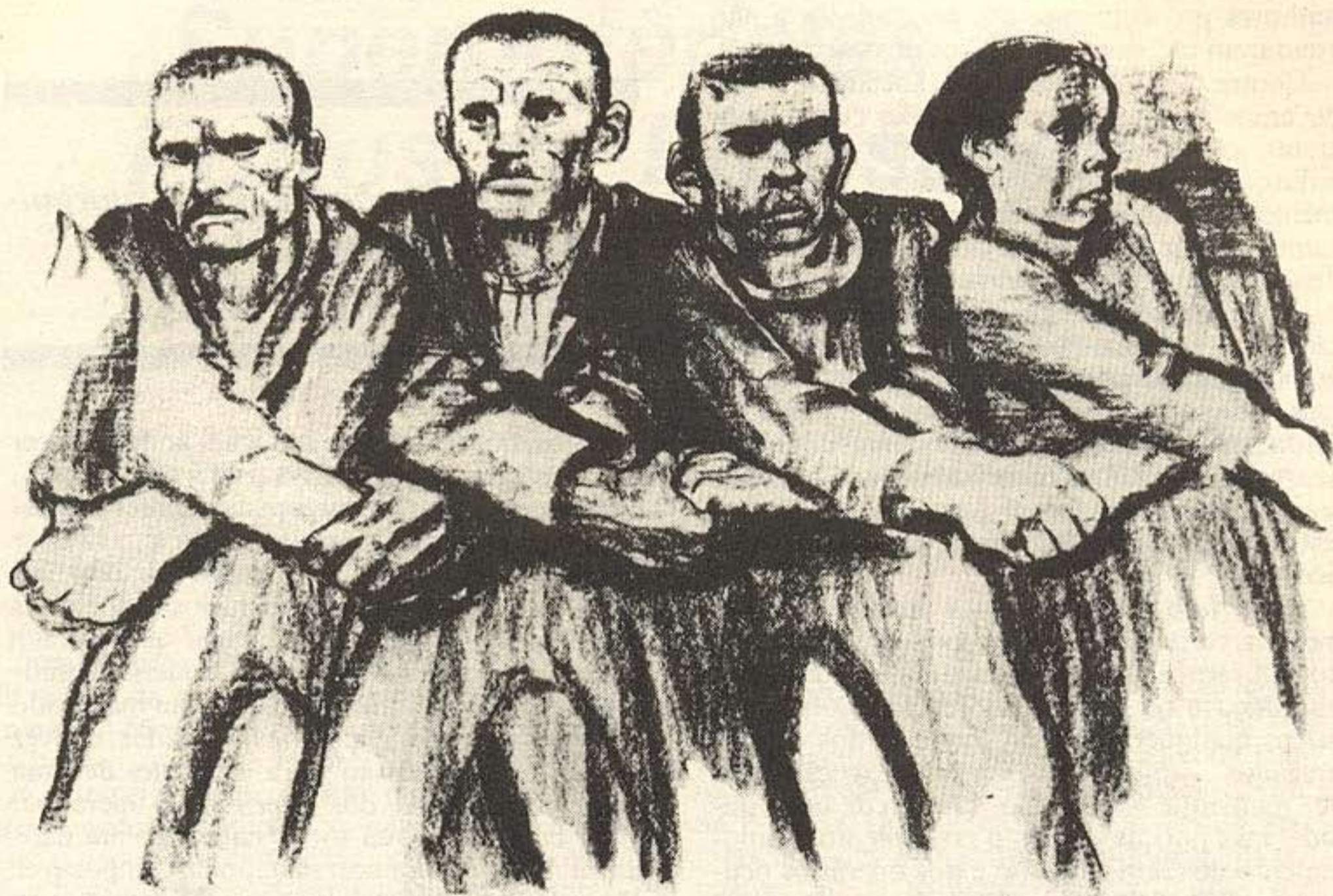
K. KOLLWITZ. "Solidariedade"

atuais do estômago vazio com o problema da derrubada do capitalismo e da instauração da ditadura do proletariado. Todo aquele que se limita ao programa máximo, que pensa que o tempo das reivindicações parciais já passou, paralisa a energia das massas em vez de a libertar, condena as massas à passividade em vez de as ativar, adia as lutas para amanhã em vez de as travar hoje. É por isso que se deve rejeitar categoricamente a fórmula: "ou as reivindicações parciais, ou as reivindicações gerais". Nós colocamos as reivindicações parciais (seguro-desemprego organizado pelo Estado, jornada de 7 horas etc.) e ligamos estas reivindicações ao combate contra todo o sistema capitalista. A luta contra o desemprego é parte integrante da luta contra o sistema que o provoca. É necessário não cair num ou noutro extremo. Nem a palavra-de-ordem "somente as reivindicações gerais", nem a palavra-de-ordem "somente as reivindicações parciais", mas a combinação das reivindicações parciais e gerais. Este é o signifi-