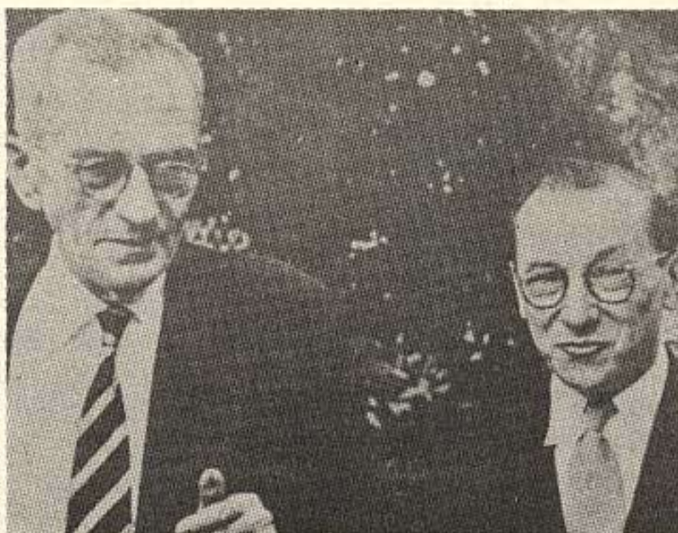
Graciliano Ramos com Portinari.

No sentido de restaurar a verdade, no momento em que tantas calúnias são apresentadas como verdade boa e autêntica, e tantas posições verdadeiras são escondidas no sentido de se apresentar as calúnias como paradigma da verdade e a verdade como componente de uma pseudomentira, vale a pena transcrever um documento pouco conhecido no qual Graciliano